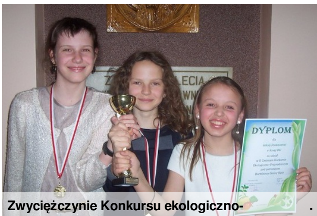
Zwyciężczynie Konkursu ekologicznego