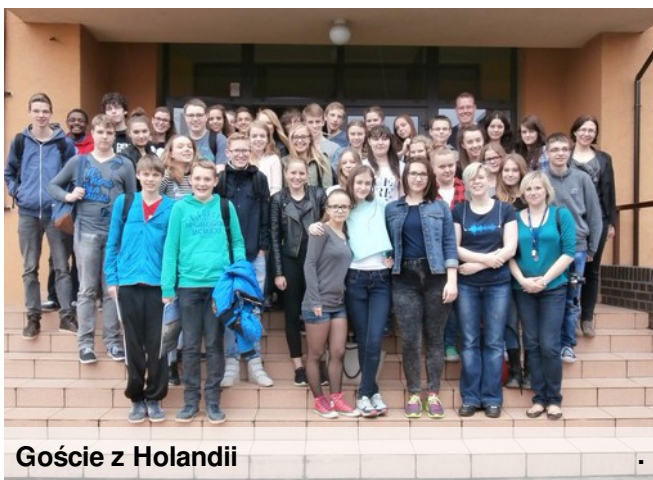
Goście z Holandii