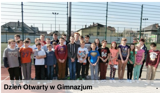
Dzień Otwarty w Gimnazjum