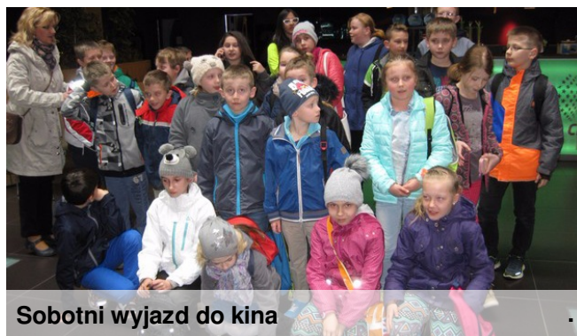
Sobotni wyjazd do kina