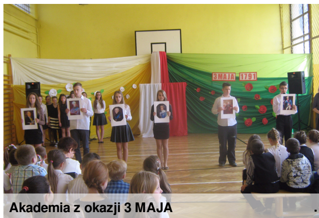
Akademia z okazji 3 MAJA