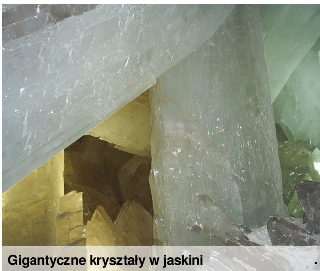
Gigantyczne kryształy w jaskini