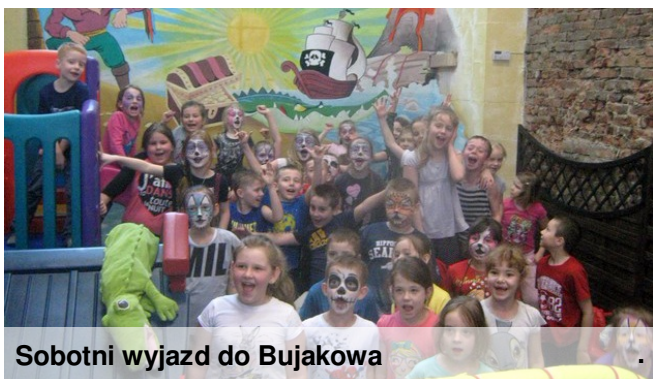
Sobotni wyjazd do Bujakowa