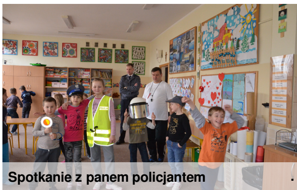
Spotkanie z panem policjantem

Gdzie te czasy, gdy dziewczynki chciały zostać krawcowymi albo nauczycielkami. W sondzie szkolnej uczniowie deklarowali, że marzą o karierze policjanta albo pilota lotniczego. Duża część zostanie kierowcą.