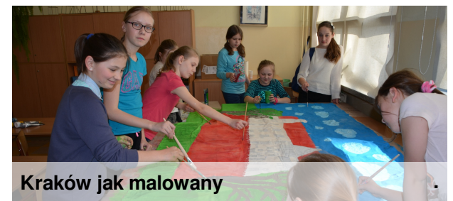
Kraków jak malowany