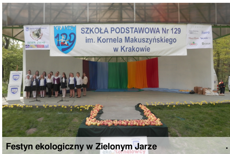
Festyn ekologiczny w Zielonym Jarze

Dziesięcioosobowy zespół EKO-Kornelowców przygotował lokalny festyn dla mieszkańców Wzgórz Krzesławickich. Część oficjalna odbyła się w muszli koncertowej. Uczniowie zaprezentowali ekologiczne piosenki, pokaz tańców towarzyskich oraz moralizatorskie scenki promujące świadome korzystanie z natury.