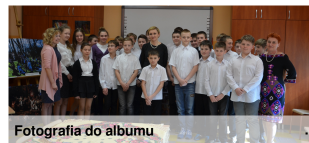
Fotografia do albumu

Fragment rozmowy: - Doskonale pamiętam swoją klasę ze szkoły podstawowej. Wiele zawdzięczam swojej pani wychowawczyni. Zapewne wy docenicie troskę swoich nauczycieli, gdy wejdziecie w dorosłe życie- powiedziała Pani Wiceprezydent. - Bardzo lubimy swoją szkołę - odparli uczniowie. Oby tak było zawsze.