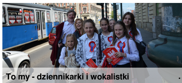
To my - dziennikarki i wokalistki