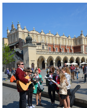
Występ w Krakowie.

3 maja to szczególny dzień w kalendarzu. Jest nam niezwykle miło, że mogliśmy uczestniczyć w życiu kulturowym Krakowa. Śpiewając na Rynku, wzruszaliśmy turystów i krakowian. Nasze zdjęcia obiegają zapewne cały świat.