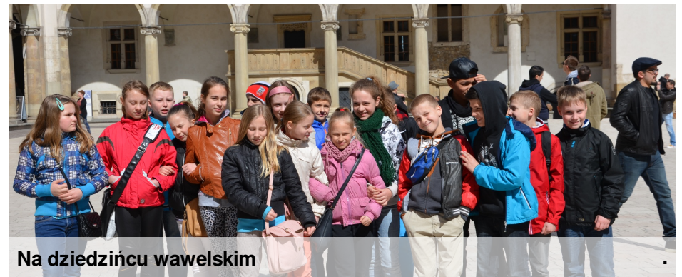
Na dziedzińcu wawelskim

Nie od razu Kraków zbudowano... J ednak my go szybko poznaliśmy