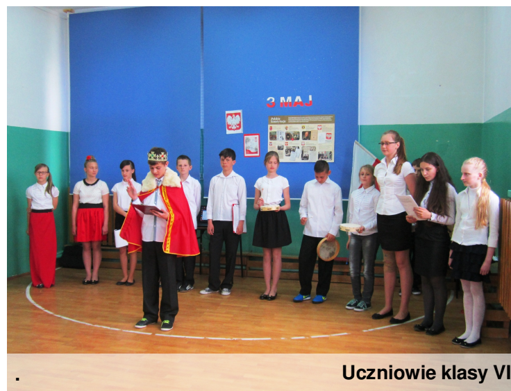
Uczniowie klasy VI