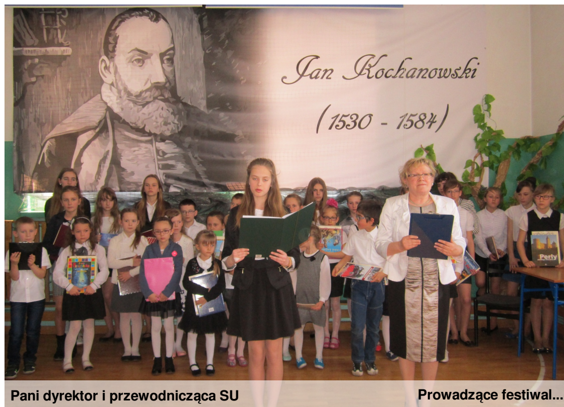
Pani dyrektor i przewodnicząca SU