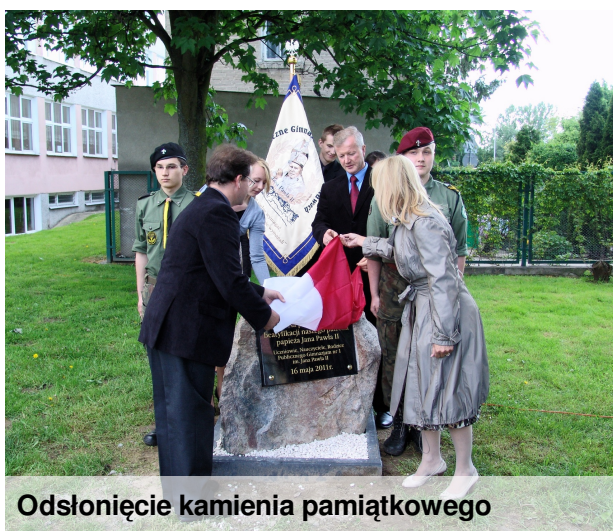
Odsłonięcie kamienia pamiątkowego