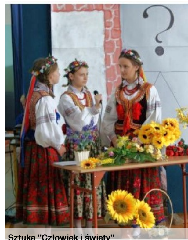
Sztuka "Człowiek i święty"