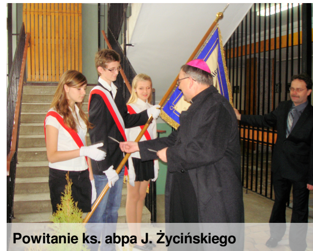
Powitanie ks. abpa J. Życińskiego

msza święta. Uczestnicy mieli okazję także wysłuchać wykładu o wizji edukacji według nauczania papieża. Dzięki spotkaniu z uczniami innych szkół poczuliśmy się częścią jednej wielkiej wspólnoty.