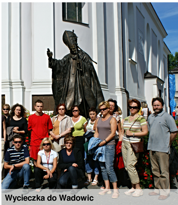
Wycieczka do Wadowic