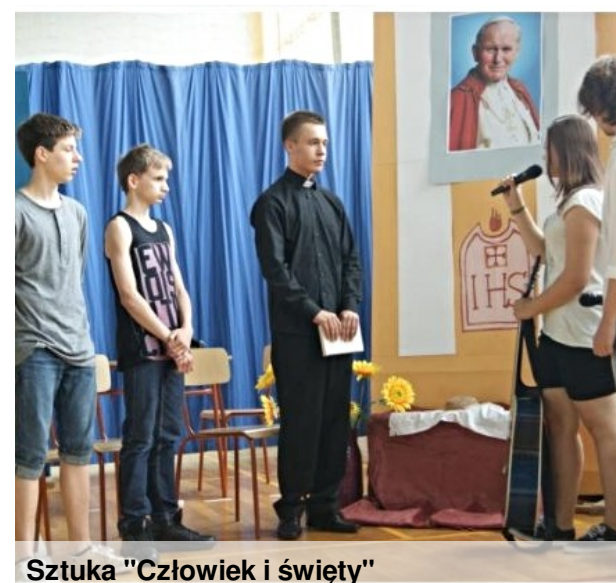
Sztuka "Człowiek i święty"