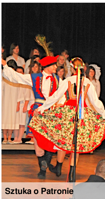
Sztuka o Patronie

Nawiązano kontakt korespondencyjny ze szkołami imienia Jana Pawła II. 26 czerwca 2009 r. delegacja z gimnazjum udała się do Lublina na spotkanie z księdzem arcybiskupem Józefem Życińskim. Celem tej wizyty było uzyskanie pozwolenia nadania szkole imienia naszego wielkiego rodaka - Jana Pawła II.