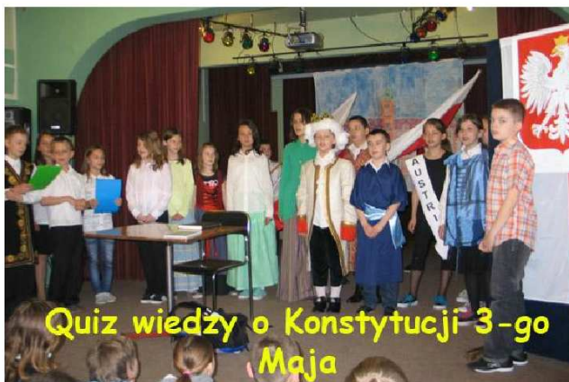
Quiz wiedzy o Konstytucji 3-go Maja

4. Jakie zmiany według monarchii wносиła Konstytucja 3 Maja? znosiła ustrój monarchii