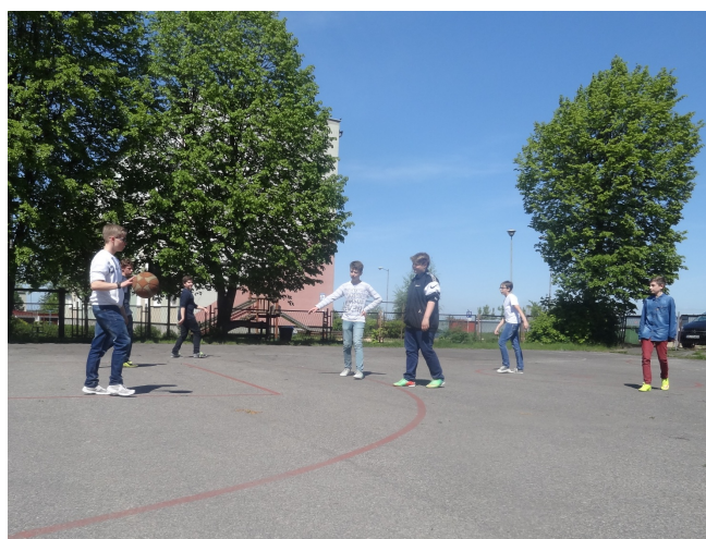
Klasa 1b na boisku szkolnym

Ile razy w ciągu ostatniego czasu słyszałeś od rodziców: Nie siedź przed tym komputerem! Rusz się! Wyjdź na dwór! Myślisz sobie, znowu to zrządzenie... Nic bardziej mylnego! Warto posłuchać rodziców i skorzystać z dobrej porady. Ruszając się, spalasz kalorie, chudniesz i dotleniaasz swój mózg, a co za tym idzie, lepiej funkcjonujesz w szkole. Wyjście na podwórko nie musi się wcale wiązać z leniwym i nudnym spacerem. W ramach swojej aktywności możesz namówić kolegę lub koleżankę na bardzo modne w tym sezonie rolki lub rower. Przejazdka na świeżym powietrzu na pewno doda Ci energii i witalności. Nie zapominaj też o ćwiczeniach. Ich ilość i rodzaj powinna być dostosowana do Twoich możliwości, skorzystaj więc z porady nauczyciela wychowania fizycznego.