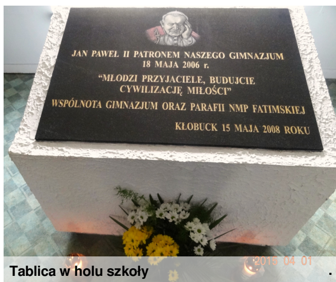
Tablica w holu szkoły

Młodzi przyjaciele, budujcie cywilizację miłości