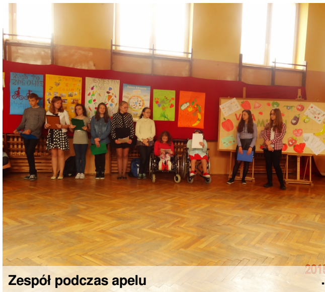
Zespół podczas apelu