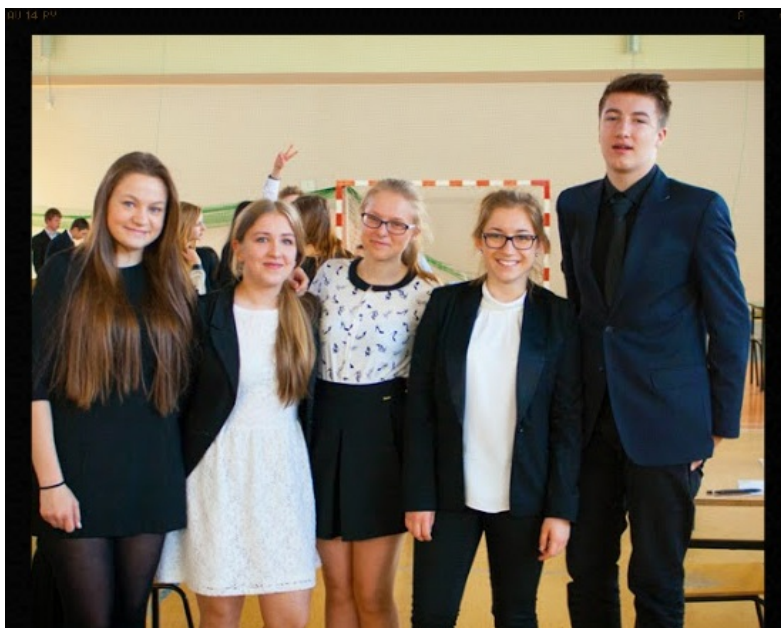
Trzecioklasiści podczas egzaminu

To były bardzo ważne chwile dla naszych trzecioklasistów. W odświętnych strojach stawili się w murach szkoły, aby sprawdzić swoją wiedzę i umiejętności. Każdy z nich pragnął jak najlepiej wypaść, aby potem móc dostać się do wymarzonej szkoły.