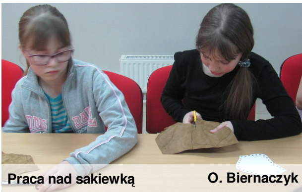
Praca nad sakiewką