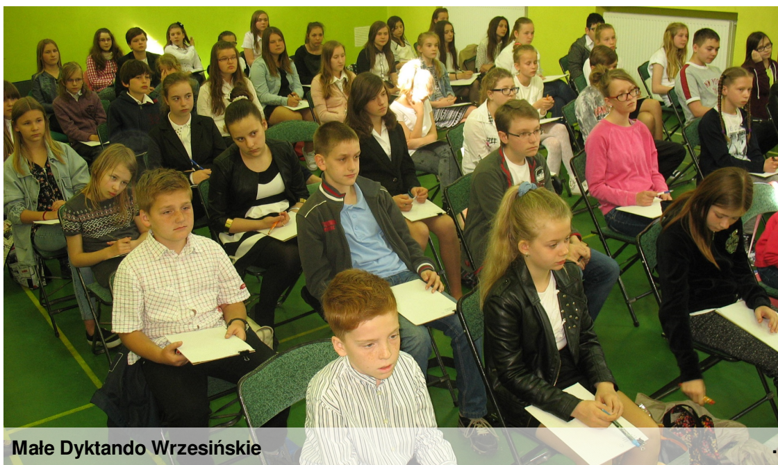
Małe Dyktando Wrześnińskie