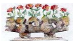
CZŁOWIEK DLA CZŁOWIEKA BRATEM