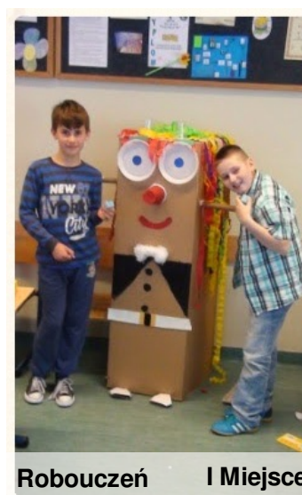
Robouczeń I Miejsce