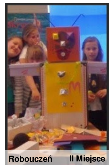
Robouczeń II Miejsce