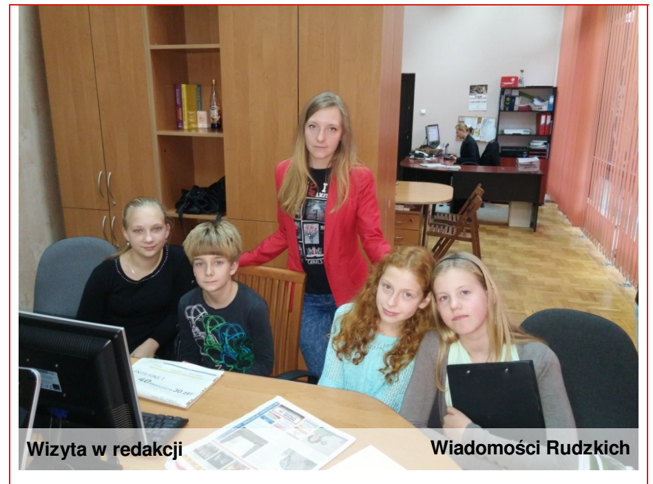
Wizyta w redakcji

5.R: Jak długo pani pracuje w Wiadomościach Rudzkich i czy lubi pani tę pracę?