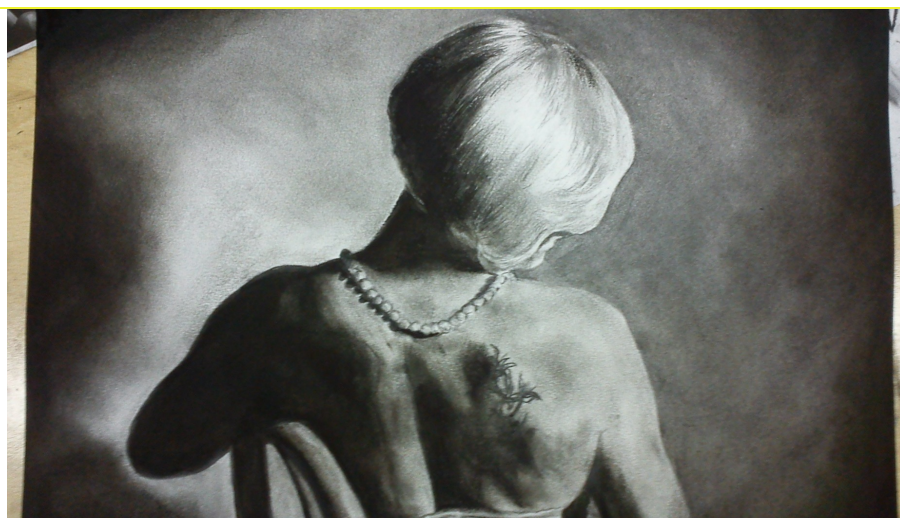
Praca w ołówku