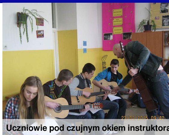
Uczniowie pod czujnym okiem instruktora