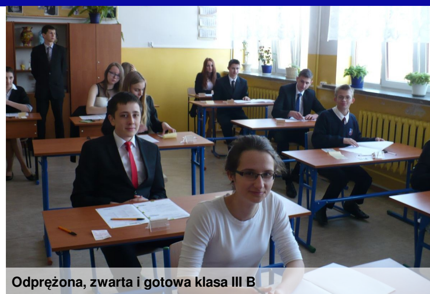
Odprężona, zwarta i gotowa klasa III B