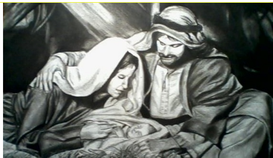
Praca w ołówku