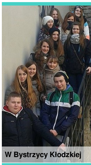
W Bystrzycy Kłodzkiej

Kilkudniowe zmagania językowe zostały uwieńczone uroczystym podsumowaniem projektu, podczas którego gimnazjaliści otrzymali certyfikaty. Zaświadczają one o tym, że uczestnicy przeszli szkolenie z zakresu: konferencja prasowa, leadership, poznaj Unię Europejską, praca i motywacja w grupie, program Erasmus +, poznawanie kultur świata, prowadzenie prezentacji i autoprezentacji, Debata Oksfordzka, wolontariat oraz tzw. szok kulturowy.