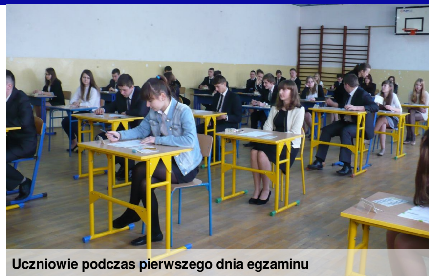
Uczniowie podczas pierwszego dnia egzaminu