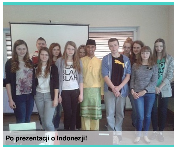
Po prezentacji o Indonezji!