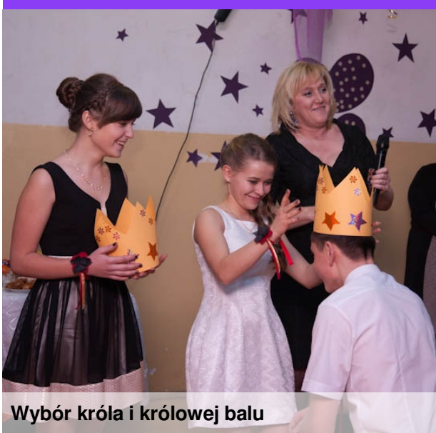
Wybór króla i królowej balu