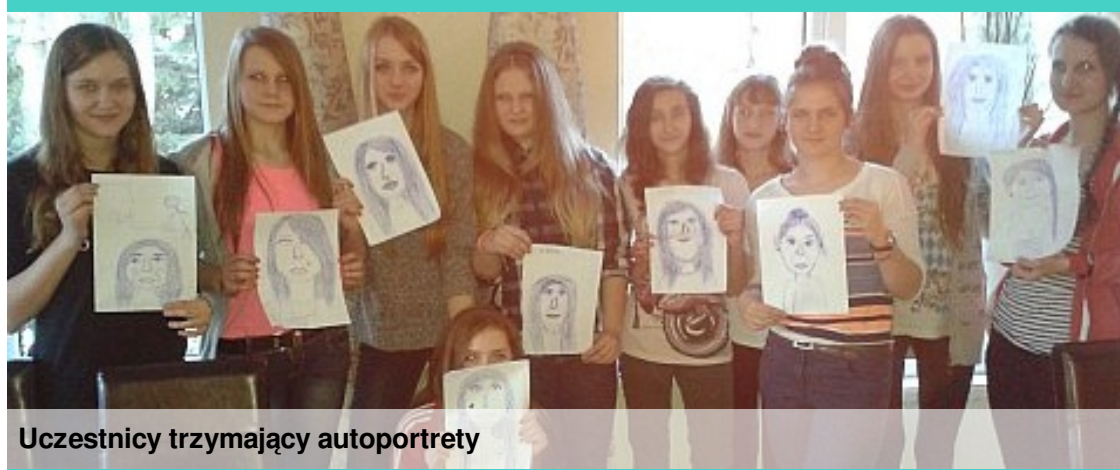
Uczestnicy trzymający autoportrety