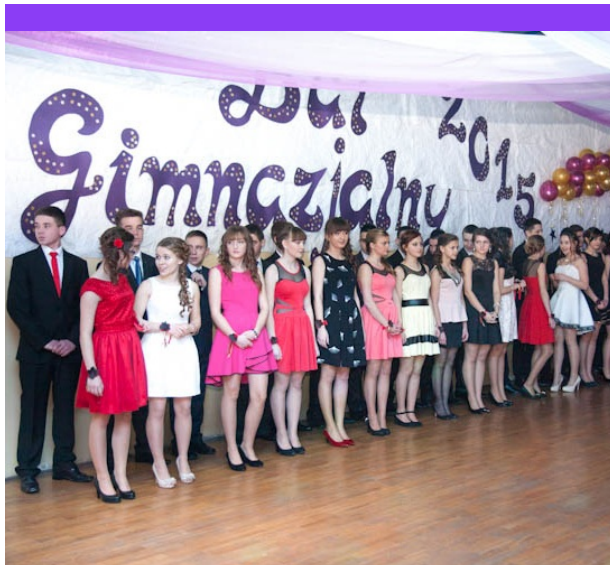
Trzy oddziały klasy III - zdjęcie grupowe