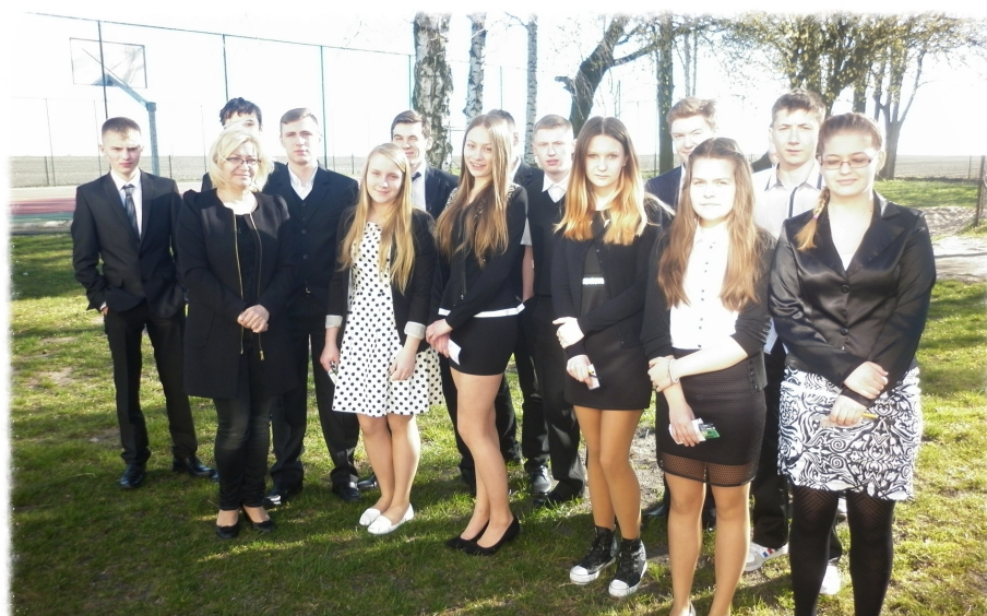
Klasa III gimnazjum