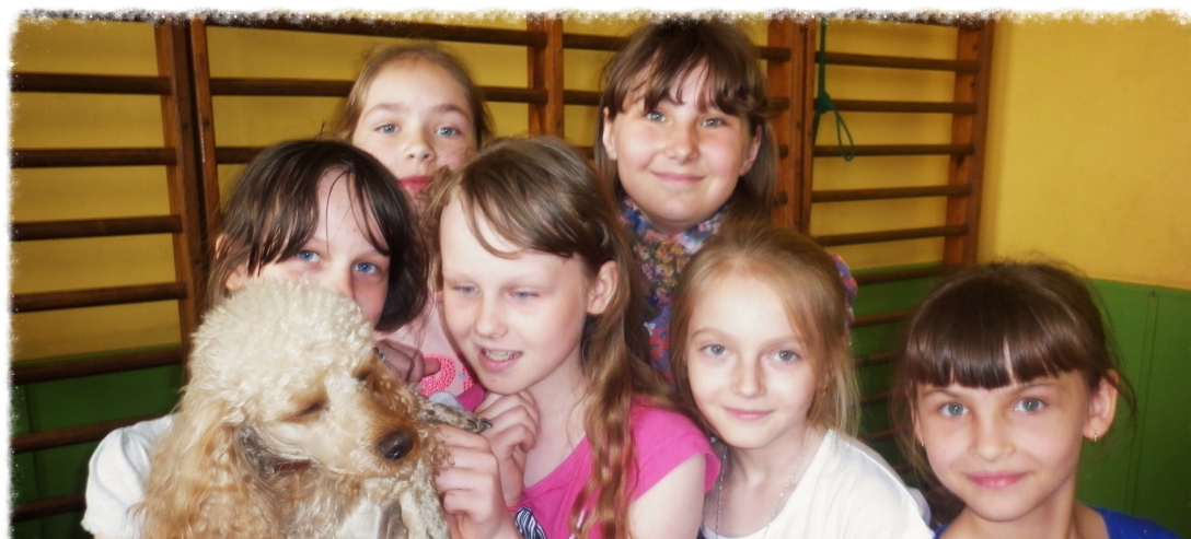
Z cyrkowym pudelkiem