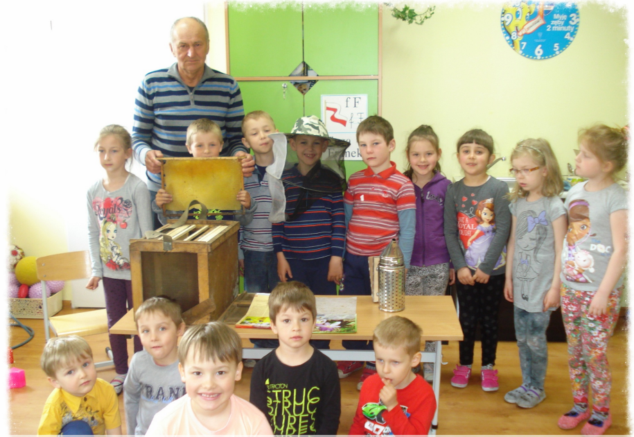
Spotkanie przedszkolaków z panem pszczelarzem

o życiu pszczół, ich pracy i zwyczajach oraz znaczeniu w przyrodzie. Dzieci mogły z bliska obejrzeć przyrządy pszczelarza tj, przenośny ul, podkurzacz, specjalny kapelusz, dymkę i ramki z ula.