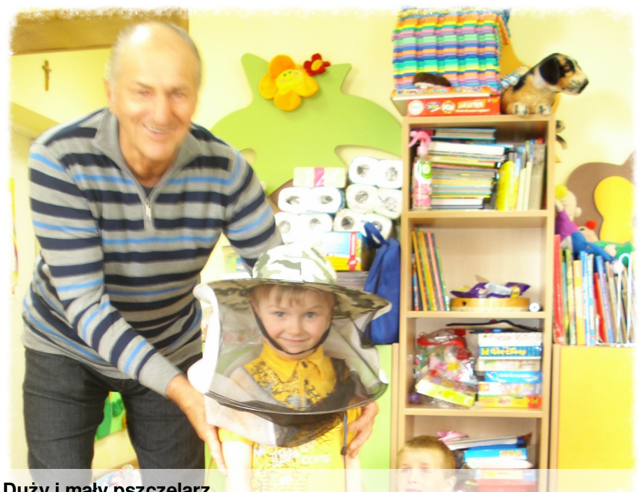
Duży i mały pszczelarz