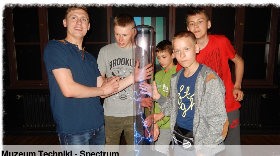
Muzeum Techniki - Spectrum