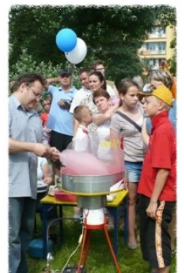
Dzień Dziecka Stawowski