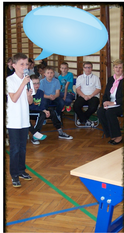
Zabawa: Kim jestem?