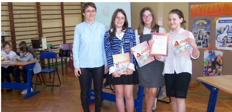
Zwycięska drużyna wraz z polonistką