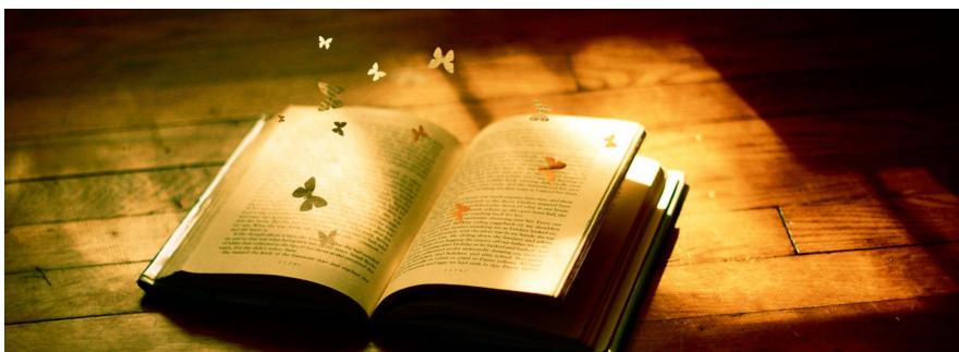
Kto czyta, żyje wielokrotnie...