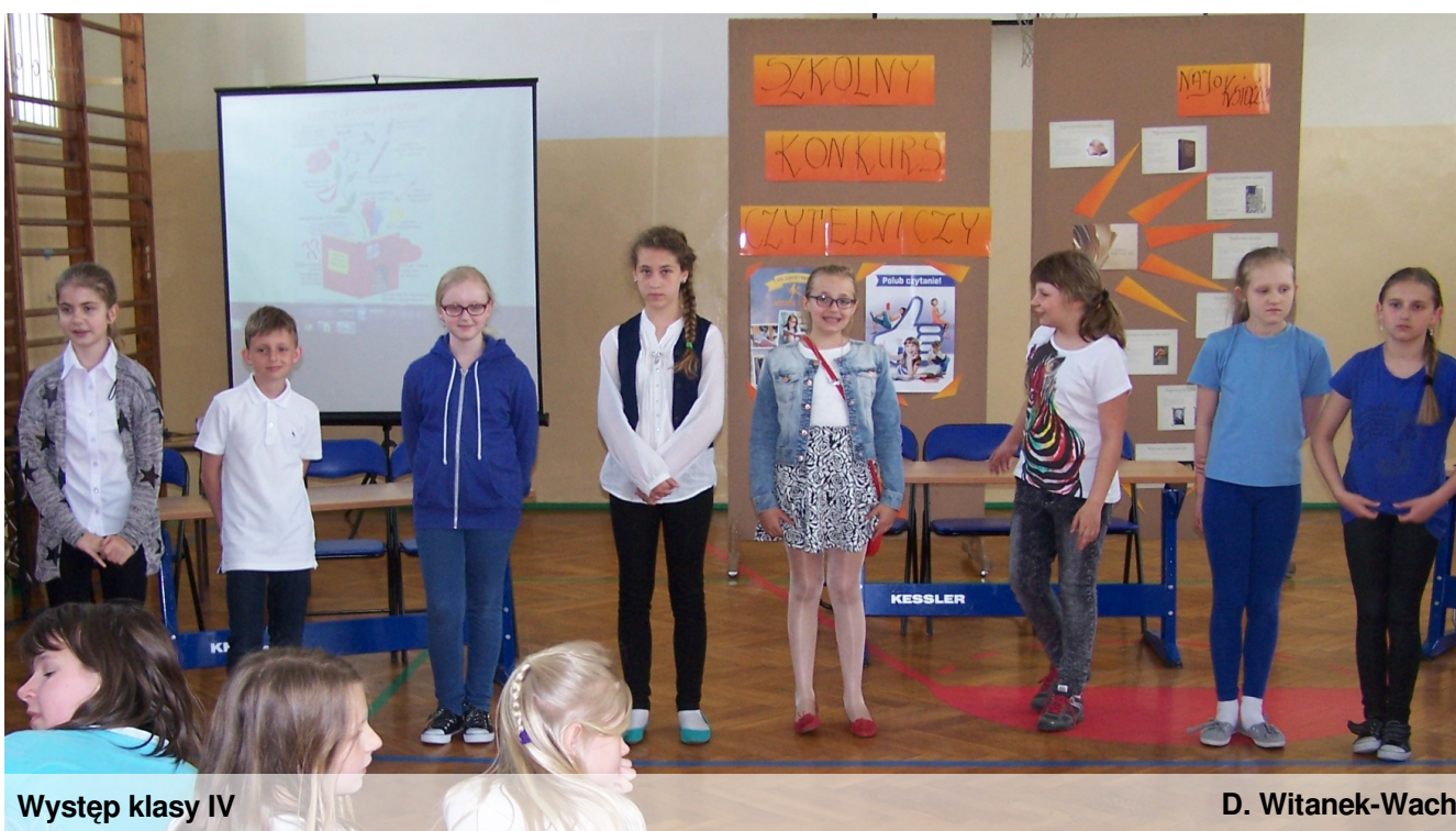
Występ klasy IV