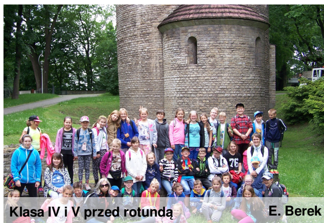
Klasa IV i V przed rotundą