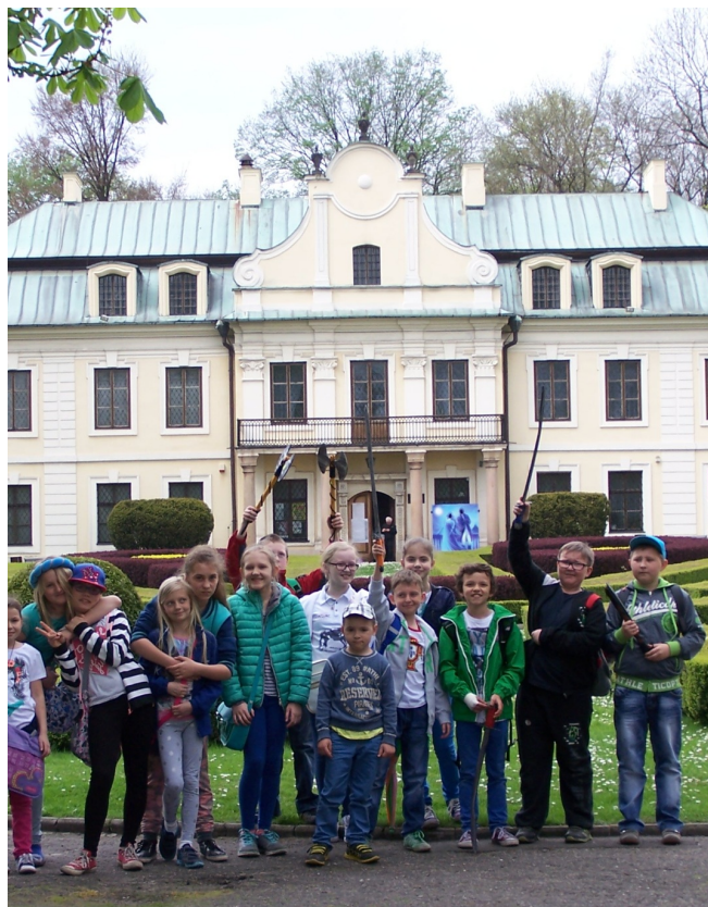
Przed Pałacem Mieroszewskich