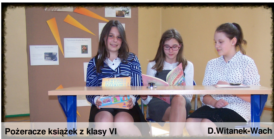
Pożeracze książek z klasy VI