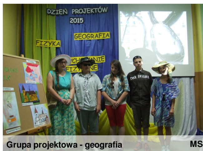
Grupa projektowa - geografia

Projekty edukacyjne to świetna zabawa i rozwijanie naszych zainteresowań