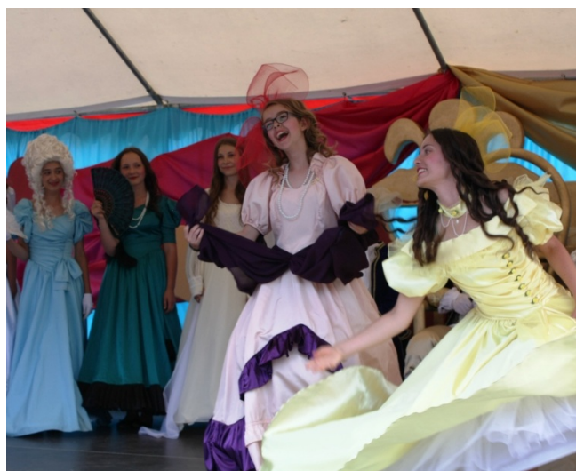
"Kopciuszek" w wykonaniu gimnazjalistów