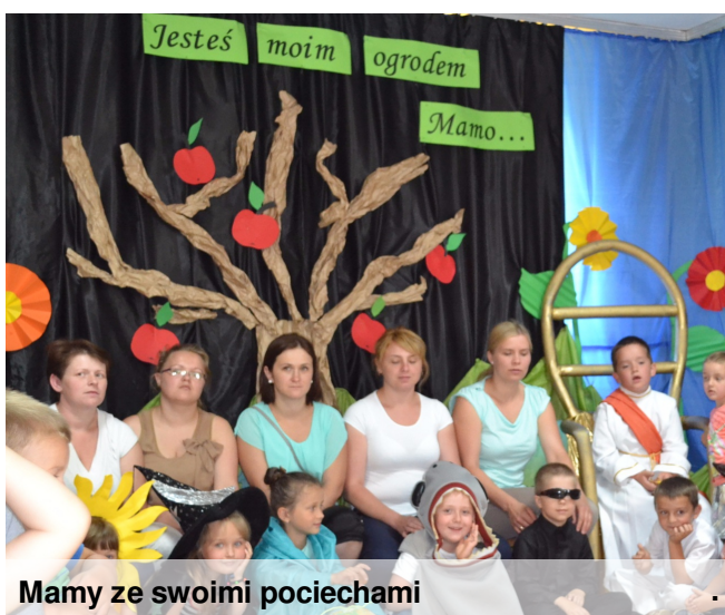
Mamy ze swoimi pociechami