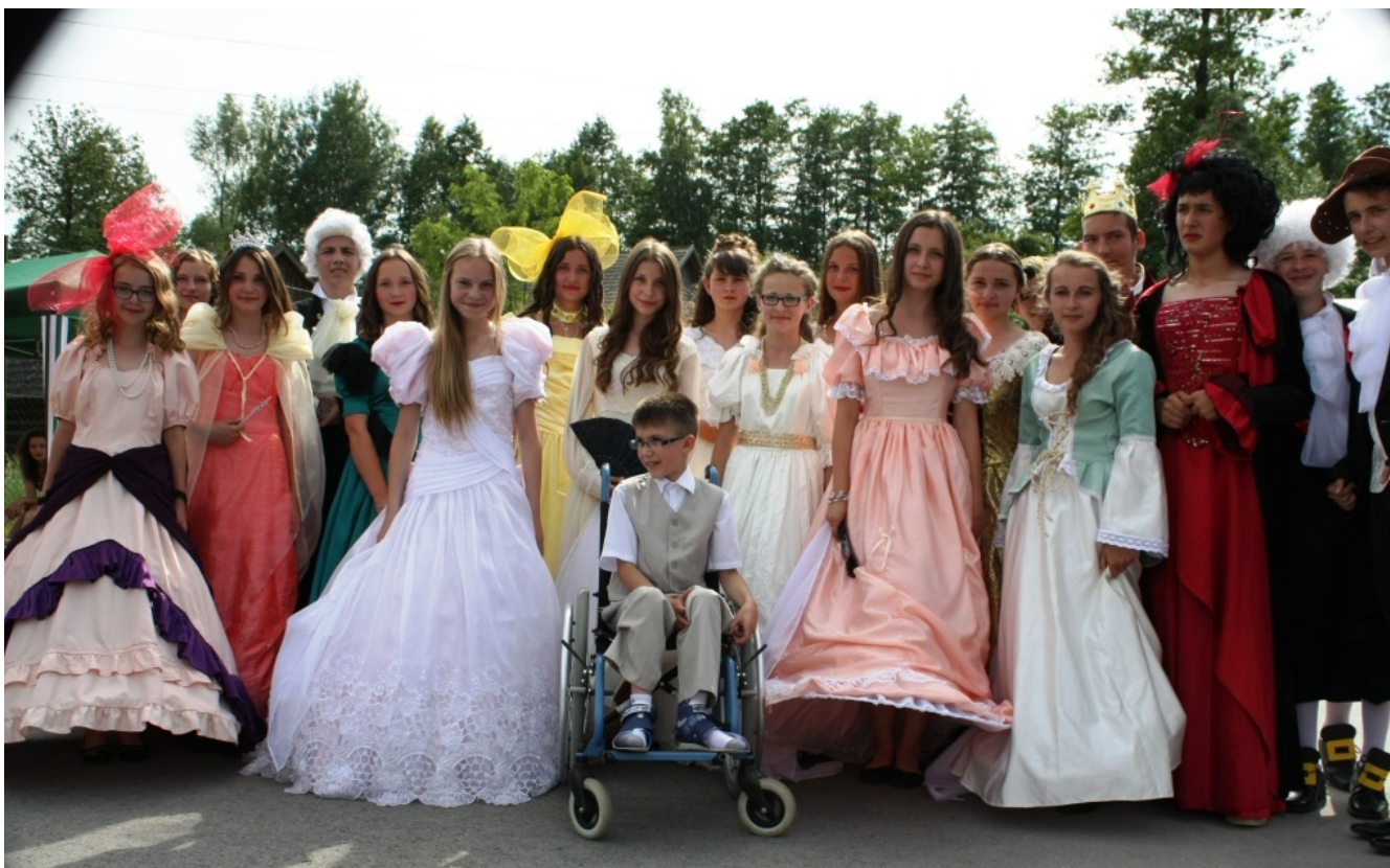
Gimnazjaliści w przedstawieniu pt. "Kopciuszek" zdjęcie z Kamilkiem