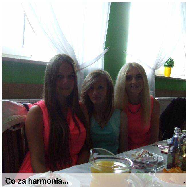
Co za harmonia...