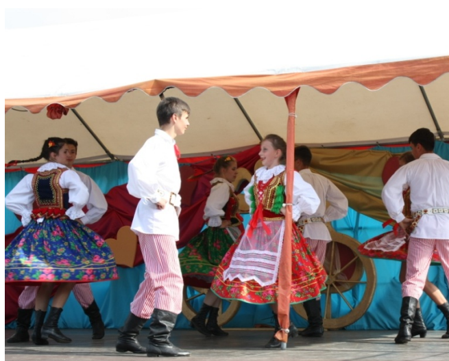
Występy młodzieży z Wielopola Skrz.