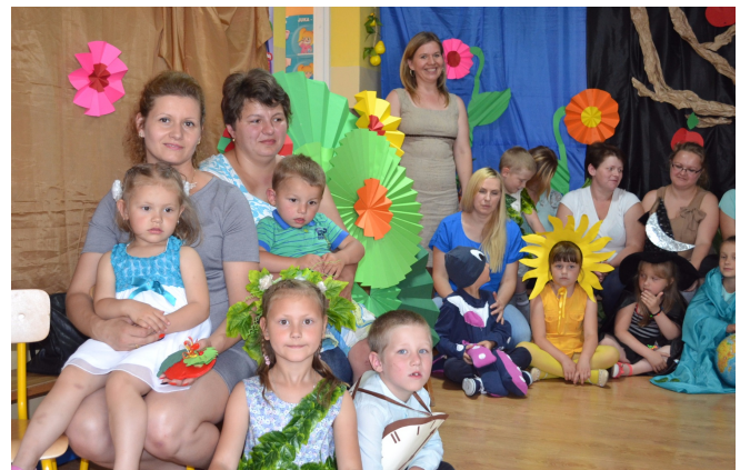
Mamy ze swoimi pociechami 10.06.2015 10:39