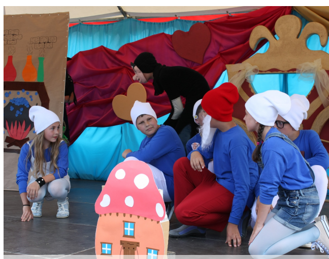
"Smerfy" w wykonaniu kl. IV - VI