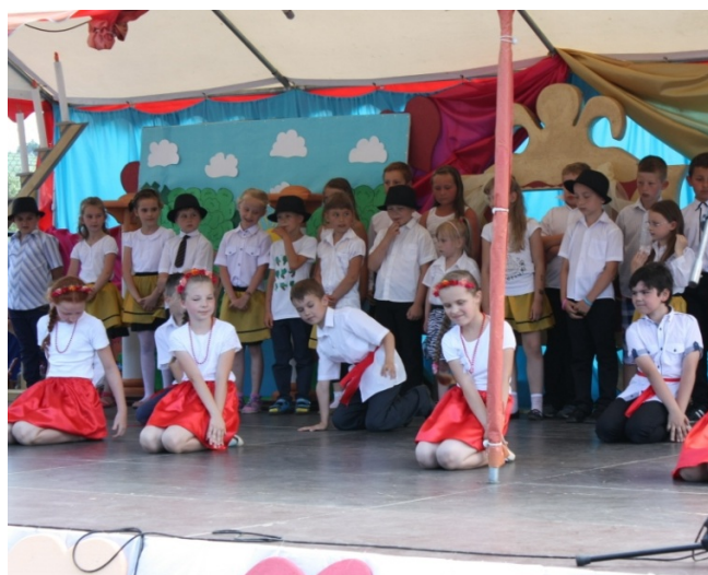
Występy najmłodszej grupy