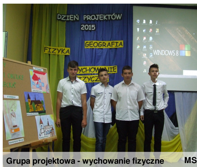
Grupa projektowa - wychowanie fizyczne