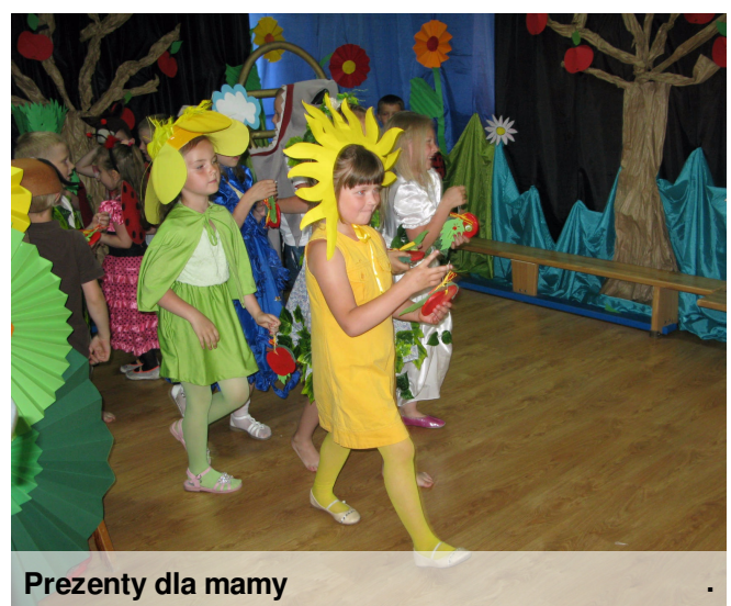
Prezenty dla mamy