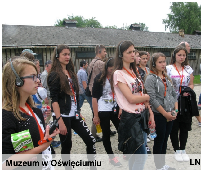
Muzeum w Oświęcimiu

dlaczego czynna była tylko toaleta męska, ale lepsze to niż nic). Następnie zjedliśmy śniadanie i udaliśmy się na mszę. Spokojnie można powiedzieć, że mało kto, cokolwiek pamięta, bo wróciliśmy do życia dopiero podczas przechodzenia na klęczkach wokół ołtarza. Kolejne dwie godziny zwiedzaliśmy wały częstochowskie. Byliśmy również na wieży widokowej, chociaż łatwo nie było się na nią dostać, bo schody były kręte. Później pojechaliśmy do Ogrodzienca. Niektórzy mieli ochotę pozostać na dłużej w pięknych ruinach. Co prawda kierunek zwiedzania był wyznaczony, ale kto by tam na to patrzył, kiedy najciekawsze jest to, co zabronione. Nasze panie czuwały zresztą nad nami cały czas. Pod koniec zwiedzania złapał nas deszcz, więc wszyscy pobiegli pędem do autobusu. Trochę zmoknięci i zmarznięci pojechaliśmy do Auschwitz. W drodze nastąpiło ładowanie, czyli zbieranie sił. Niemalże każdego zmorzył sen, co oczywiście nie uszło uwadze naszych fotografów. Śpiochy, mogą mieć tylko nadzieję, że te zdjęcia nigdzie nie wyciekną. W końcu dojechaliśmy do obozu. Już na wstępie musieliśmy zrobić dwie dodatkowe rundki na parking i z powrotem, bo okazało się, że na teren muzeum nie można wejść z torbami, więc musieliśmy odnieść je do autobusu, który wcale nie był tak blisko. Od pani przewodniczki otrzymaliśmy słuchawki (żeby wszystko dobrze