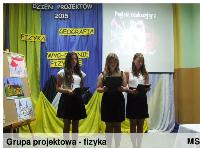
Grupa projektowa - fizyka