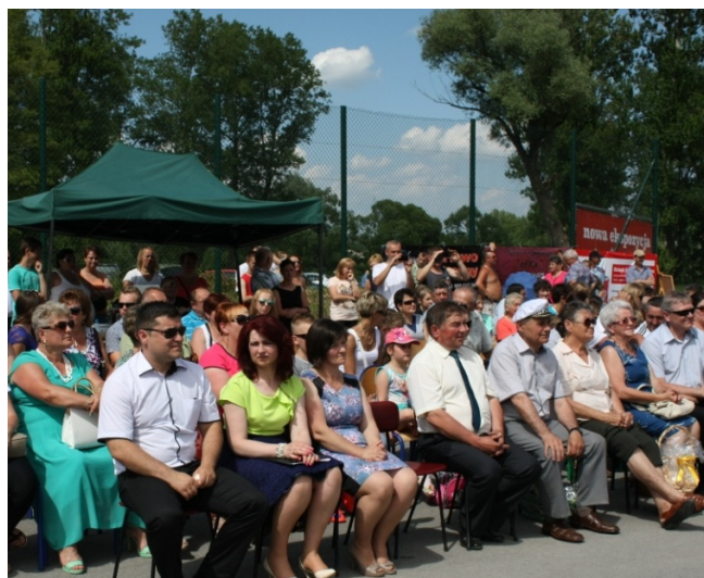
Zaproszeni goście oraz mieszkańcy