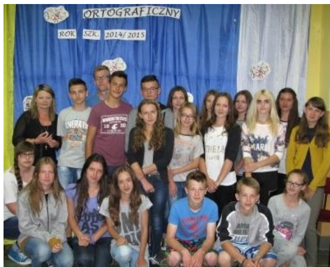
Najlepiej piszący gimnazjaliści