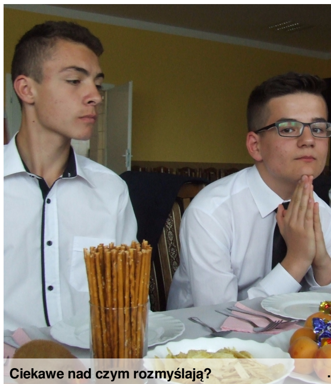
Ciekawe nad czym rozmyślają?