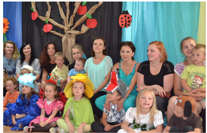
Mamy ze swoimi pociechami 10.06.2015 10:38