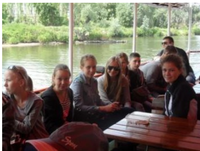
Rejs statkiem po Odrze