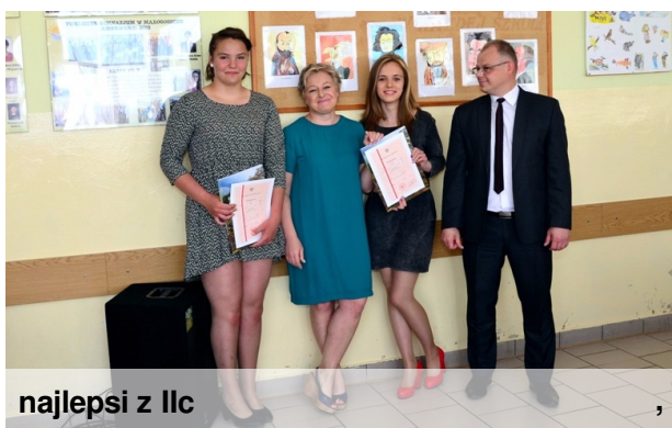
najlepsi z IIc