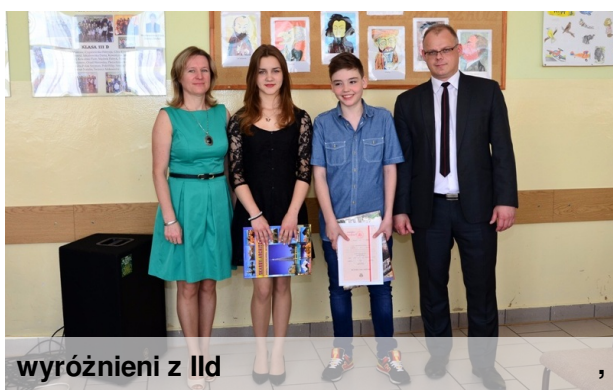
wyróżnieni z IId