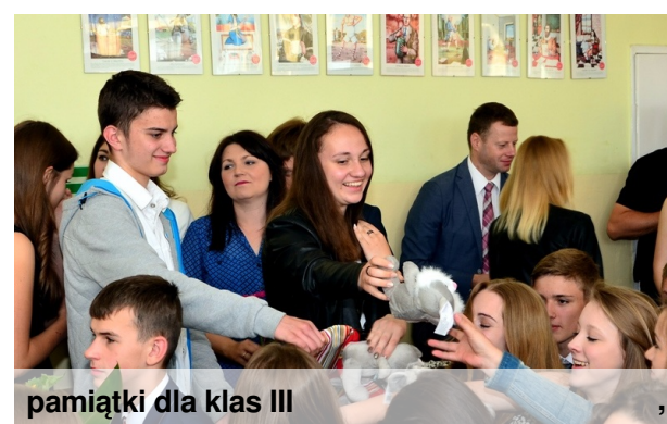
pamiątki dla klas III