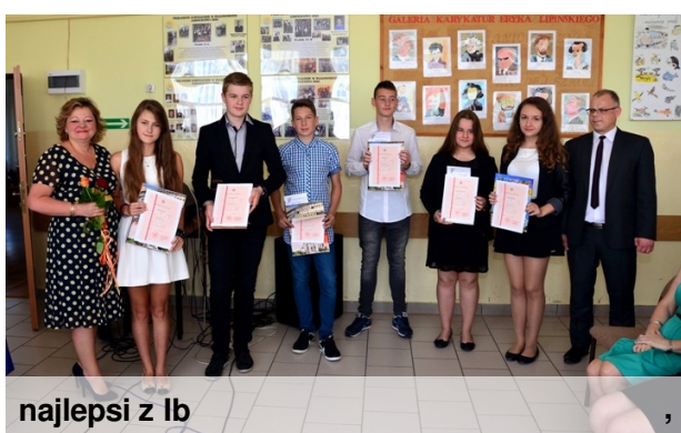
najlepsi z Ib