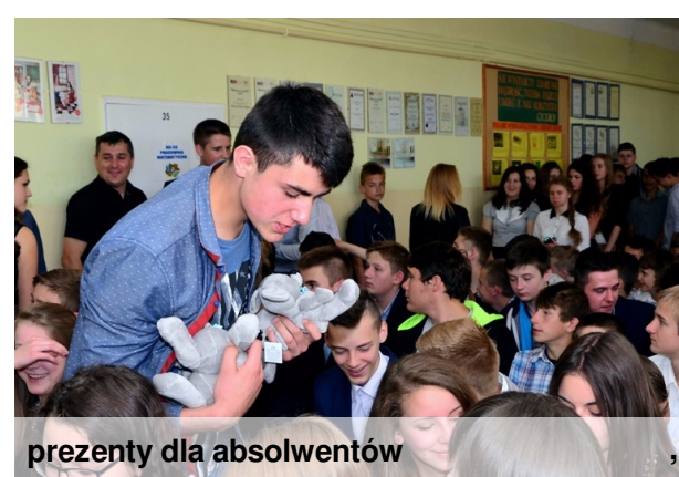
prezenty dla absolwentów