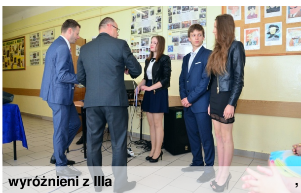
wyróżnieni z IIIa