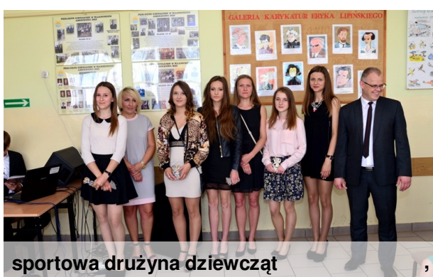
sportowa drużyna dziewcząt