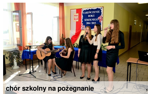
chór szkolny na pożegnanie