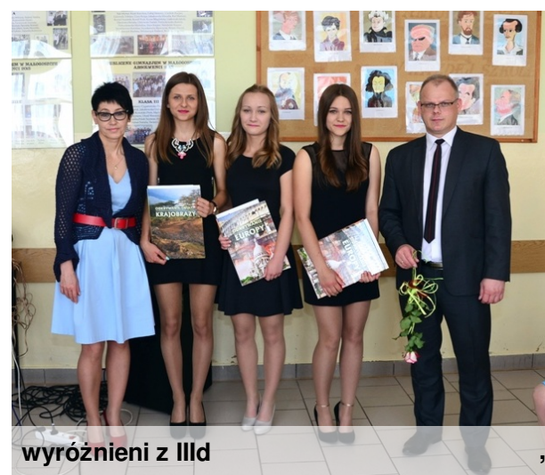
wyróżnieni z IIId