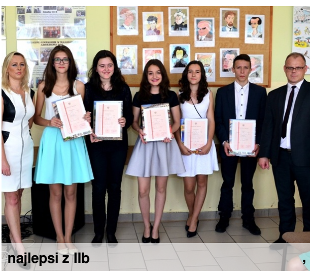
najlepsi z IIb