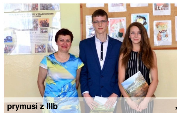
prymusi z IIIb