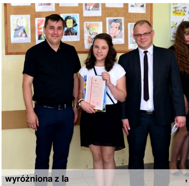
wyróżniona z Ia