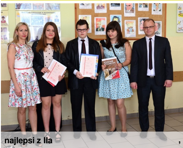
najlepsi z Ila

Uczniowie Ia i Ila - klas z najwyższą średnią na I semestr roku szkolnego 2014/2015 oraz kilkoro uczniów z wysokimi wynikami z pozostałych klas pierwszych i drugich w nagrodę 18 czerwca br. uczestniczyli w wycieczce do kina i do Muzeum Henryka Sienkiewicza w Oblęgorku.