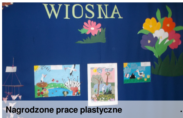
Nagrodzone prace plastyczne