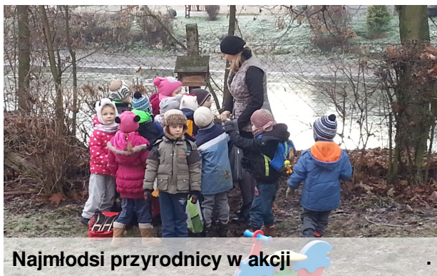
Najmłodszy przyrodnicy w akcji

Bez wsparcia ludzi, mniej doświadczone, stare bądź osłabione ptaki i zwierzęta mają nikłe szanse na przeżycie w okresie mrozów i obfitych opadów śniegu. Dokarmianie naszych skrzydlatych i czworonożnych przyjaciół to doskonały sposób na zrobienie czegoś pożytecznego i wartościowego. W okresie zimy Koło Łowieckie dostarcza nam pokarm, a my mimo, że na dworze mróz, z przyjemnością udajemy się na remizę śródpolną z wiadrami pełnymi ziarna dla bażantów i kuropatw.