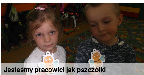
Jesteśmy pracownicy jak pszczółki