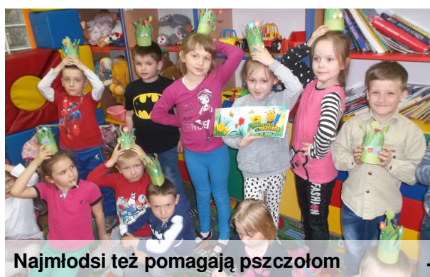
Najmłodszy też pomagają pszczołom

To program edukacyjny, dzięki któremu najmłodszy poznają pszczeli świat i zdobywają wiedzę na temat tych pożytecznych owadów. W oddziale przedszkolnym odbyło się szereg działań związanych z tą akcją. Dzieci dobrze znają zasady, którym kieruje się przyjaciel pszczół, w myśl których nie czyni im krzywdy. Na podstawie zdobytych informacji dzieci wykonały sylwety pszczół i makiety łąk, obserwowały zachowanie owadów w naszym szkolnym ogrodzie.