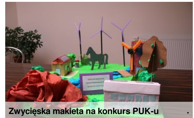
Zwycięska makieta na konkurs PUK-u

Uczniowie klas IV-VI wzięli udział w konkursie „Odnawialne Źródła Energii w mojej okolicy” ogłoszonym przez Stowarzyszenie „Tilia”. Polegał on na skonstruowaniu makiety swojej miejscowości urządzonej na sposób ekologiczny. Do makiety należało dołączyć opis uzasadniający zasadność i wpływ na środowisko przedstawionych w makiecie rozwiązań. Wybrane makiety zostały przewiezione do Szkoły Leśnej na Barbarce. Podobny konkurs ogłosiło PUK w Lipnie. Swoją makietę na konkurs zgłosili uczniowie klasy V- przedstawiając swoją wizję na ten temat. I choć nie udało się im zająć punktowanego miejsca to każdy z nich otrzymał nagrodę pocieszenia w postaci słuchawek multimedialnych.