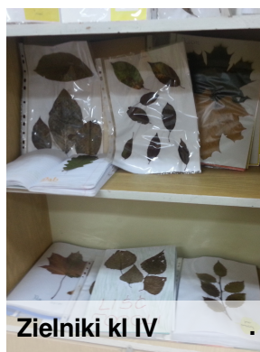
Zielniki kl IV