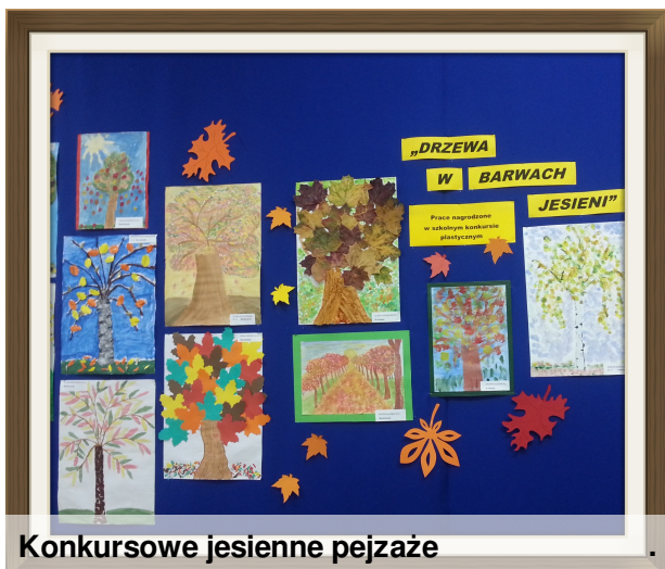
Konkursowe jesienne pejzaże

Aby sprawnie przeprowadzać obserwacje przyrodnicze w terenie, potrzebne są kompas, plan i mapa , pozwalające swobodnie poruszać się i nie błądzić. Ponadto każdy przyrodnik dobrze posługuje się aparatem fotograficznym, lornetką i lupą. Na zajęciach przyrodniczych w terenie bezpośrednio poznajemy przyrodę, co jest o wiele ciekawsze niż siedzenie w ławce szkolnej. Wszystkie poczynione obserwacje dokumentujemy za pomocą notatki lub rysunku oraz redagujemy i uzasadniamy wnioski. Taki sposób postępowania uczy nas właściwego stosunku do świata przyrody.