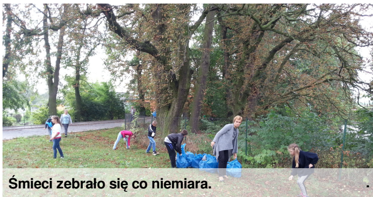
Śmieci zebrało się co niemiara.

Ważnym wydarzeniem w kalendarzu każdego ekologa jest Akcja Sprzątania Świata. Jakość środowiska, w którym żyjemy to sprawa codziennych wyborów każdego z nas i każdy z nas może w codziennym swoim funkcjonowaniu trochę ulżyć środowisku. We wrześniu odbyło się wielkie sprzątanie. Uczniowie poszczególnych klas ruszyli na wyznaczone obszary robić porządki. Wiele radości sprawiły uczniom atrakcje które towarzyszyły akcji: zabawy i konkursy oraz gorąca grochówka z garkuchni i kielbaski z ogniska.