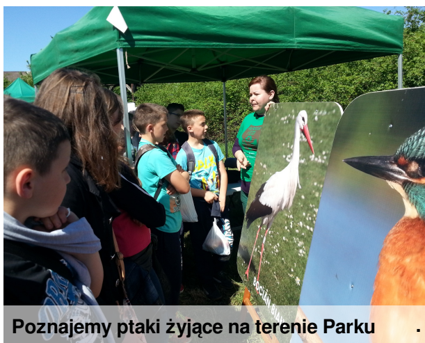
Poznajemy ptaki żyjące na terenie Parku

Blisko 50 uczniów z naszej szkoły wzięło udział w wyjazdowych zajęciach w Nadgoplańskim Parku Krajobrazowym organizowanych w ramach projektu „ Eko Skrzat z przyrodą Pomorza i Kujaw za pan brat ”. Uczniowie sprawdzali swoje wiadomości rozpoznając ptaki i zwierzęta leśne, w licznych zabawach ruchowych i grach planszowych utrwalali zdobytą wiedzę przyrodniczą, chętnie brali udział w przyrodniczym kole fortuny. Dużym zainteresowaniem cieszyło się stanowisko, przy którym za pomocą odczynników chemicznych można było zbadać czystość wody. Dla młodszych atrakcyjną okazała się wspinaczka na wieżę obserwacyjną.