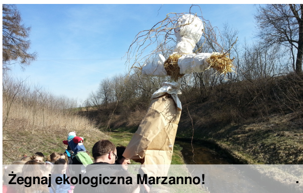
Zegnaj ekologiczna Marzanno!

Jeszcze niedawno marzyły nam nosy, a tu wielkimi krokami zawitała do nas wiosna. W naszej szkole powitaliśmy ją w poniedziałek 23 marca. Obchody rozpoczęliśmy od utopienia Marzanny, wykonanej z bioodpadów. Wykonaliśmy ekologiczną Marzannę w celu promowania ekologii, wdrażania dzieciom potrzeby przestrzegania zasad życia w zgodzie z naturą oraz wpojenia przekonania, że tradycje nie muszą być szkodliwe dla środowiska, w którym żyjemy. Także w marcu rozstrzygnięto konkurs Zwiastuny Wiosny , który polegał na wykonaniu pracy plastycznej lub technicznej przedstawiającej pierwsze oznaki tej najbardziej zielonej pory roku. Na konkurs wpłynęło wiele ciekawych prac, głównie z klas młodszych. Komisja nagrodziła trzy najpiękniejsze prace plastyczne oraz cztery prace przestrzenne. Zwycięzcy otrzymali atrakcyjne nagrody rzeczowe. Ponadto wszyscy uczestnicy otrzymali słodkie nagrody pocieszenia i dyplomy uczestnictwa w konkursie. Na zdjęciach poniżej nagrodzone prace.