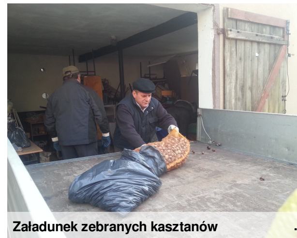
Załadunek zebranych kasztanów

Bez wsparcia ludzi, mniej doświadczone, stare bądź osłabione ptaki i zwierzęta mają nikłe szanse na przeżycie w okresie mrozów i obfitych opadów śniegu. Dokarmianie naszych skrzydlatych i czworonożnych przyjaciół to doskonały sposób na zrobienie czegoś pożytecznego i wartościowego. W okresie zimy Koło Łowieckie dostarcza nam pokarm, a my mimo, że na dworze mróz, z przyjemnością udajemy się na remizę śródpolną z wiadrami pełnymi ziarna dla bażantów i kuropatw.