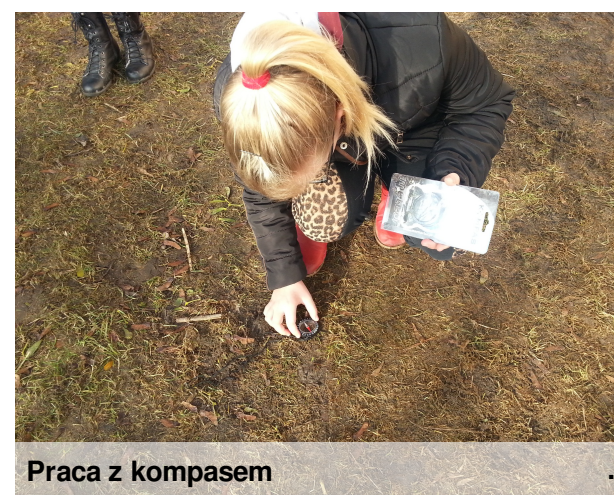
Praca z kompasem

W ramach programu "Myśliwi dzieciom, dzieci zwierzętom" przeprowadzono cykl zajęć w formie prelekcji, pogadarek, gier i zabaw edukacyjnych, w których udział wzięli niemal wszyscy uczniowie. Zajęcia te miały na celu zdobycie informacji na temat myśliwych, łowiectwa, poznania drapieżników żyjących w polskich lasach i ich roli. Zajęcia, prowadzone z użyciem otrzymanych w ramach projektu materiałów, cieszyły się dużym powodzeniem.