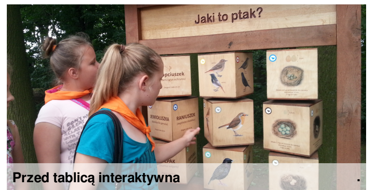
Przed tablicą interaktywną

Jeszcze w sezonie letnim odwiedziliśmy zoo w Płocku, gdzie poprzez spotkanie z żywą przyrodą zdobyliśmy wiedzę podstawową z zakresu biologii, systematyki gatunków i ochrony całych ekosystemów. Tablice dydaktyczne umieszczone przy wybiegach pozwoliły zwiedzającym poznać zwierzęta, ich biologię, zachowania i zagrożenia dla przetrwania gatunków w naturze. Na terenie ogrodu w różnych miejscach znajdują się interaktywne urządzenia, dzięki którym poprzez zabawę mogliśmy zdobyć wiedzę zoologiczną.