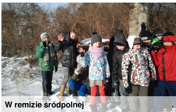
W remizie śródpolnej

Mroźna i śnieżna zima to trudny okres dla dzikich zwierząt. Gruba warstwa śniegu i lód utrudniają zwierzętom dostęp do naturalnego pokarmu i wody. Dlatego leśnicy wspólnie z myśliwymi oraz uczniami naszej szkoły pomagają zwierzętom leśnym przetrwać zimę. Co roku organizujemy w szkole zbiórkę kasztanów i żołądź, które stanowią pokarm dla saren i dzików. Te akcje na trwałe zapisały się w naszym kalendarzu i każdej jesieni zbiórka jest coraz większa, z czego jesteśmy bardzo dumni. W tym roku najwięcej kasztanów i żołądź zgromadziły dzieci z oddziału przedszkolnego.