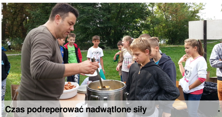
Czas podreperować nadwątlone siły

Ważnym wydarzeniem w kalendarzu każdego ekologa jest Akcja Sprzątania Świata. Jakość środowiska, w którym żyjemy to sprawa codziennych wyborów każdego z nas i każdy z nas może w codziennym swoim funkcjonowaniu trochę ulżyć środowisku. We wrześniu odbyło się wielkie sprzątanie. Uczniowie poszczególnych klas ruszyli na wyznaczone obszary robić porządki. Wiele radości sprawiły uczniom atrakcje które towarzyszyły akcji: zabawy i konkursy oraz gorąca grochówka z garkuchni i kielbaski z ogniska.