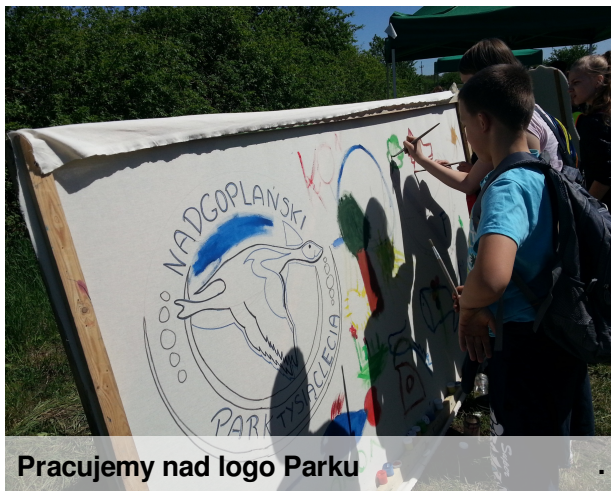
Pracujemy nad logo Parku