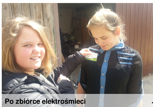
Po zbiórce elektrośmieci