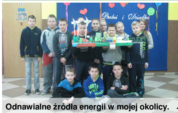
Odnawialne źródła energii w mojej okolicy.

Blisko 50 uczniów z naszej szkoły wzięło udział w wyjazdowych zajęciach w Nadgoplańskim Parku Krajobrazowym organizowanych w ramach projektu „ Eko Skrzat z przyrodą Pomorza i Kujaw za pan brat ”. Uczniowie sprawdzali swoje wiadomości rozpoznając ptaki i zwierzęta leśne, w licznych zabawach ruchowych i grach planszowych utrwalali zdobytą wiedzę przyrodniczą, chętnie brali udział w przyrodniczym kole fortuny. Dużym zainteresowaniem cieszyło się stanowisko, przy którym za pomocą odczynników chemicznych można było zbadać czystość wody. Dla młodszych atrakcyjną okazała się wspinaczka na wieżę obserwacyjną.