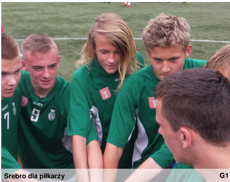
Srebro dla piłkarzy