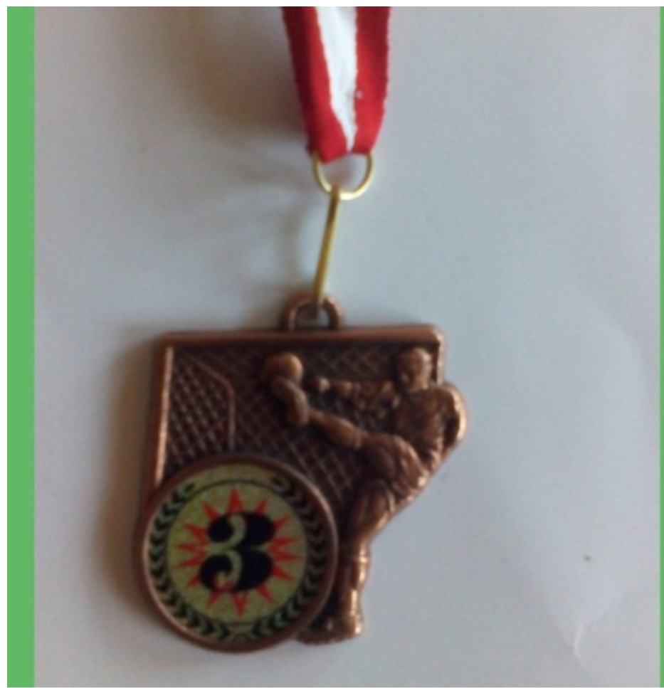
Brązowy medal piłkarek