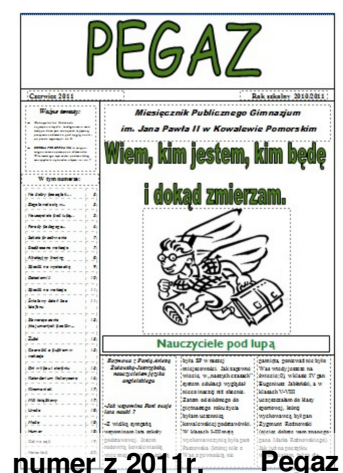
numer z 2011r. Pegaz