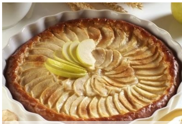
tarta z jabłkami