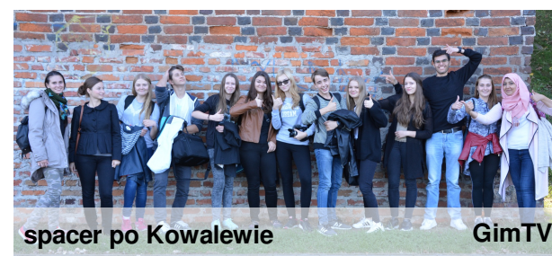
spacer po Kowalewie