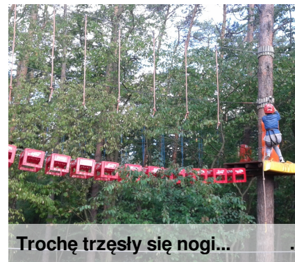
Trochę trzęsły się nogi...

Park Linowy to miejsce, gdzie duzi i mali, rodziny oraz przyjaciele, a także samotni poszukiwacze adrenaliny, znajdą moc atrakcji i niezwykłych wrażeń. My również postanowiliśmy odbyć spotkanie z tą prawdziwie ekscytującą przygodą. W piątek 18 września uczniowie klas IV- VI odwiedzili park linowy nad wrocławskim Jeziorem Czarnym. Pod okiem fachowego instruktora dzieci i nauczyciele pokonywali niebieską trasę składającą się z 12 przeszkód z przeznaczeniem dla dzieci w wieku 8-13 lat. RZECZYWIŚCIE MOŻNA TU POBUSZOWAĆ!!!