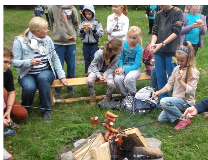
Młodzi wolą kielbaski