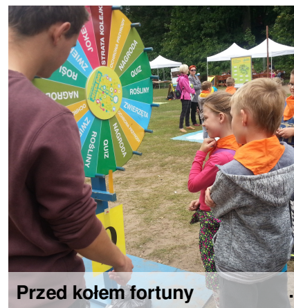
Przed kołem fortuny

Po raz kolejny bawiliśmy się na toruńskiej Barbarence. W programie festynu znalazły się konkursy i zabawy sportowe z nagrodami, zajęcia aktywizujące na następujących stanowiskach: warsztat telewizyjny, fotograficzny, dotyczący recyklingu, dotyczący energii odnawialnej, przyrodnicze koło fortuny, warsztaty garncarskie, podchody na terenie szkoły leśnej, stoiska związane z żywnością ekologiczną i inne.