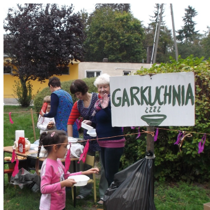
Czas na posiłek po pracy