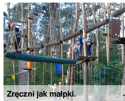
Zręczni jak małpki.