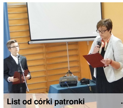
List od córki patronki