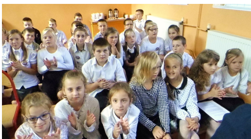
Uczniowie naszej szkoły