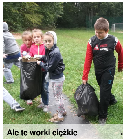
Ale te worki ciężkie