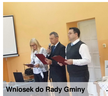
Wniosek do Rady Gminy