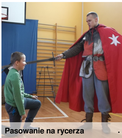
Pasowanie na rycerza