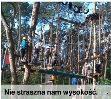
Nie straszna nam wysokość.