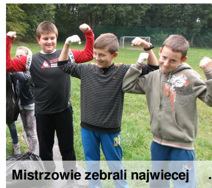
Mistrzowie zebrali najwięcej