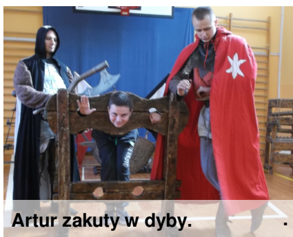
Artur zakuty w dyby.