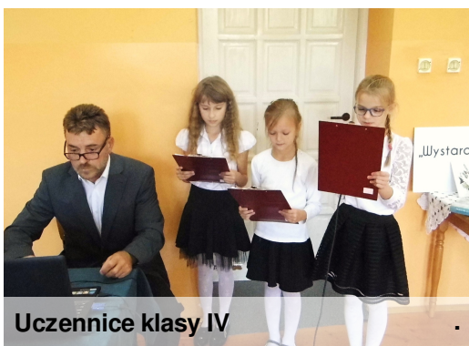
Uczennice klasy IV