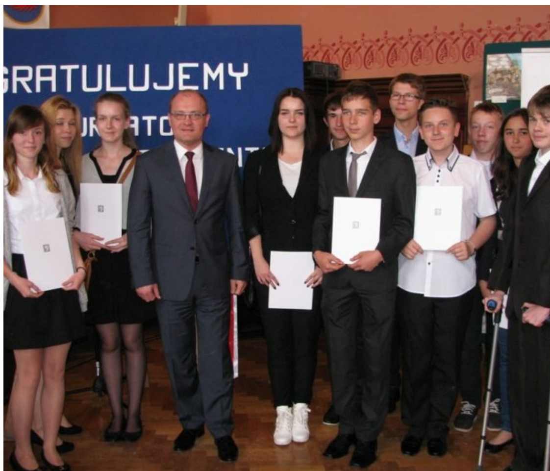
Nagroda Prezydenta Miasta Szczecin 2015