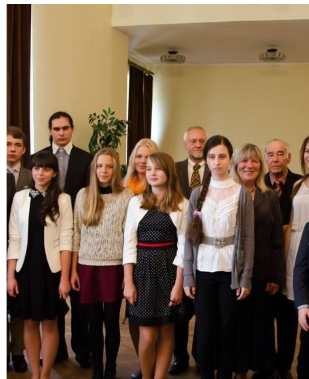
Gala laureatów konkursu