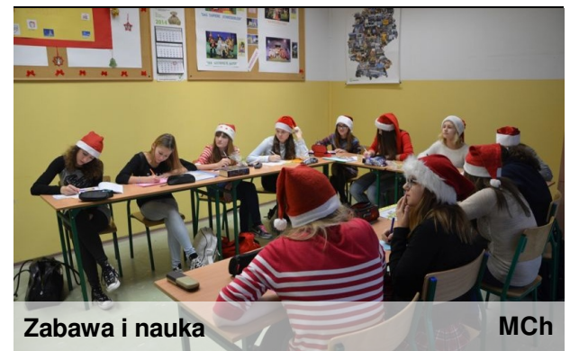
Zabawa i nauka