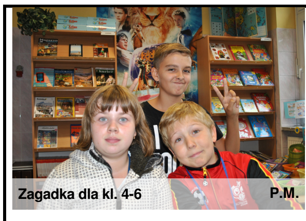
Zagadka dla kl. 4-6