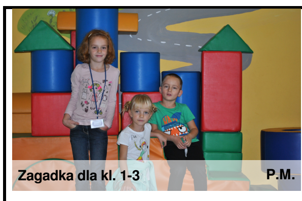
Zagadka dla kl. 1-3