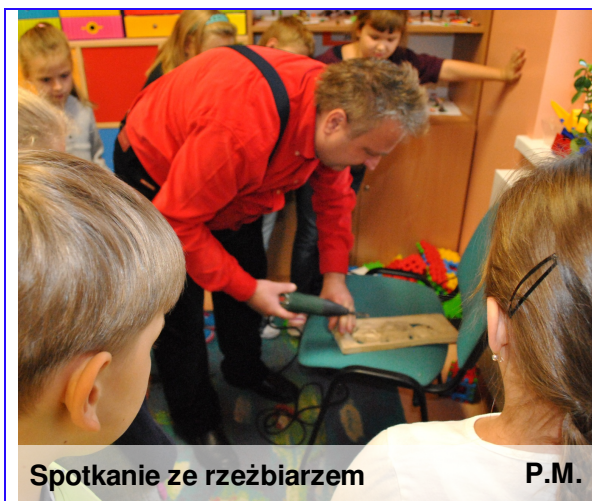
Spotkanie ze rzeźbiarzem