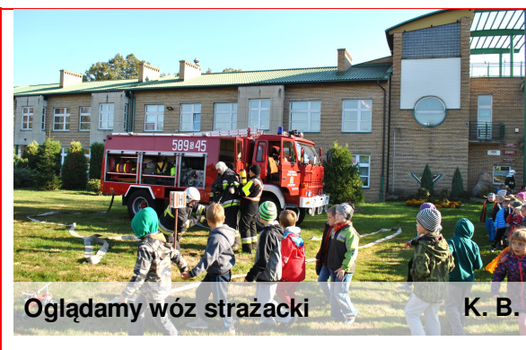
Oglądamy wóz strażacki