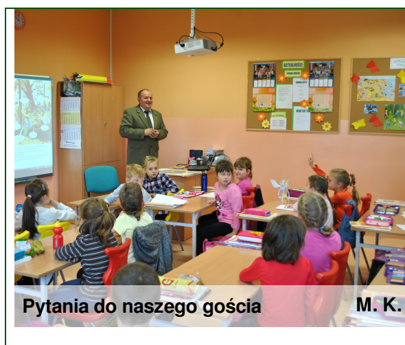
Pytania do naszego gościa