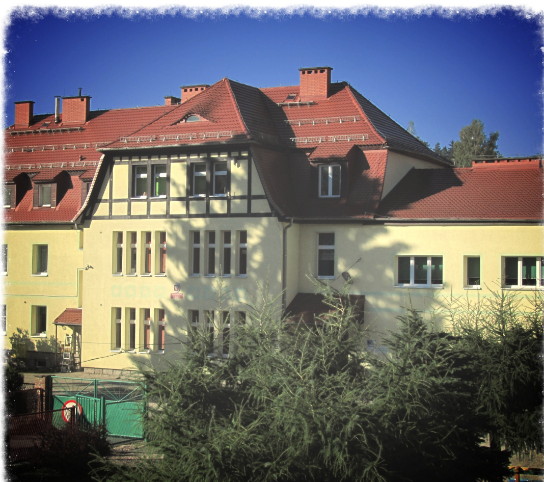
szkoła w jesiennym słońcu

Nowy rok szkolny, nowa gazetka! Witamy na łamach "Dwójki na tropie", naszej nowej gazetki uczniowskiej.