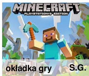
okładka gry S.G.