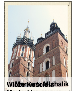
Wit Stwosz, Kościół Mariacki