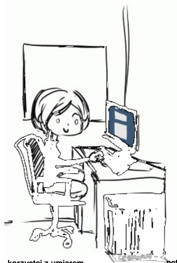
korzystaj z umiarem