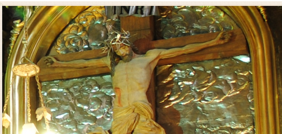
Krzyż boczny na ołtarzu Wita Stwosza

Gotyk- styl późnego średniowiecza XIV-XV w.