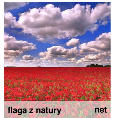
flaga z natury