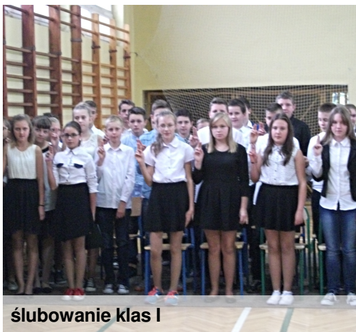
ślubowanie klas I