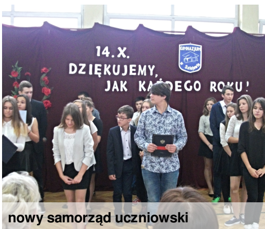
nowy samorząd uczniowski