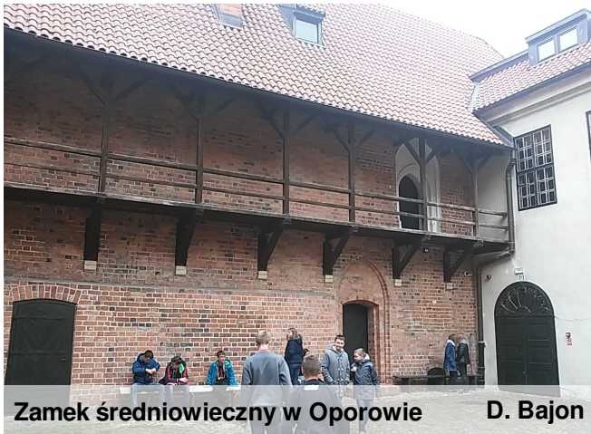
Zamek średniowieczny w Oporowie