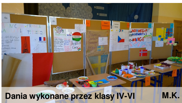
Dania wykonane przez klasy IV-VI