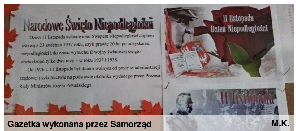
Gazetka wykonana przez Samorząd