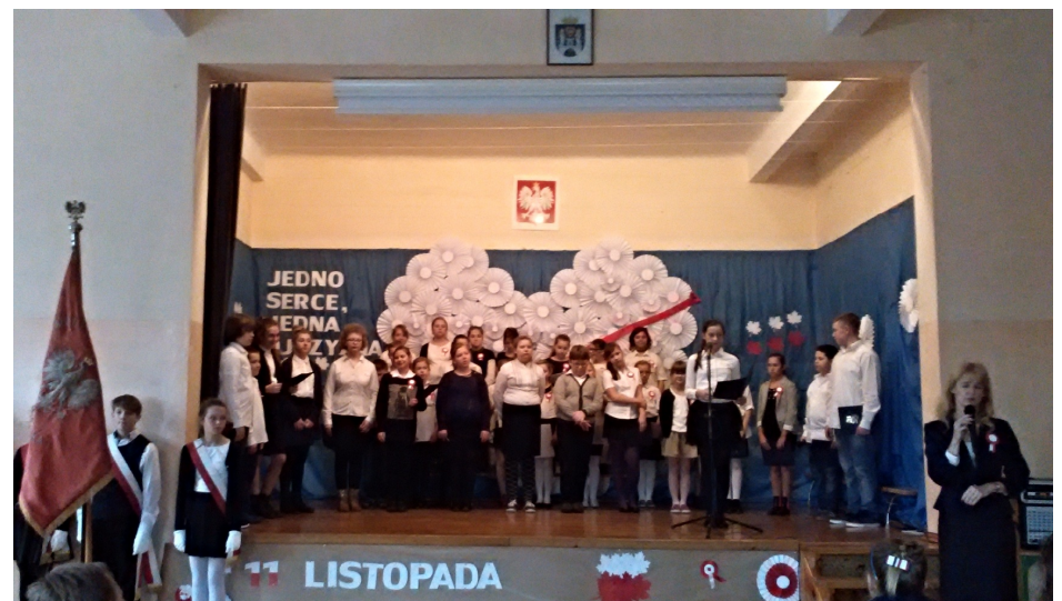
Przemówienie p. Dyrektor