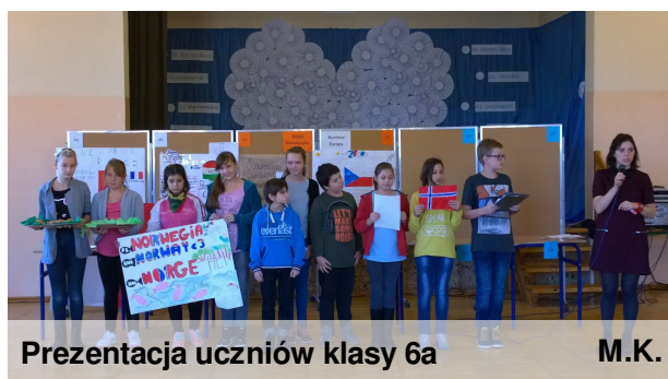
Prezentacja uczniów klasy 6a