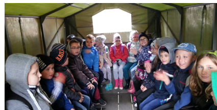
Jazda takim wozem to frajda!