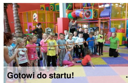
Gotowi do startu!

30 września uczniowie klas I i II odwiedzili KINDER PARK w Toruniu. Czekają tam na nich różne atrakcje: konstrukcje, zjeżdżalnie, piaskownica, samochodziki. Animatorzy prowadzili ciekawe zabawy integracyjne i szalone tańce z maskotką Hello Kitty. Dzieci mogły sprawdzić swoją tężyznę fizyczną podczas przeciągania liny oraz swoją zwinność podczas zabaw z chustą.