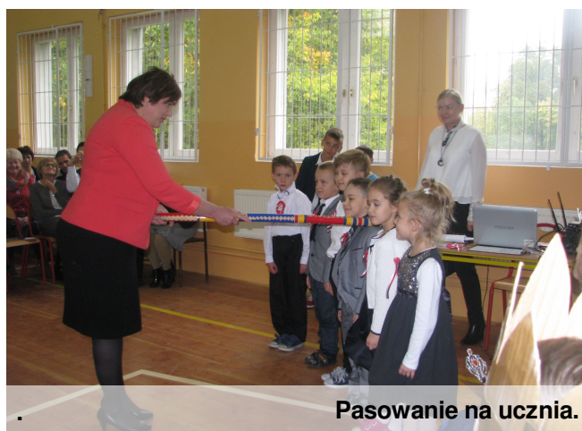
Pasowanie na ucznia.