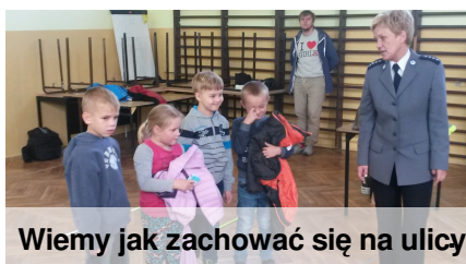
Wiemy jak zachować się na ulicy