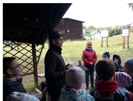
Mądrego warto posłuchać