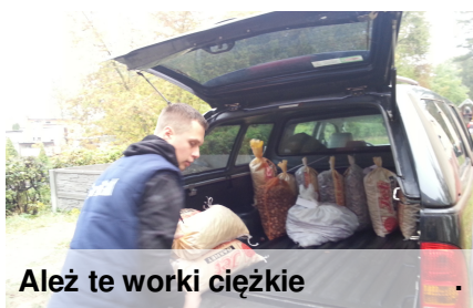
Ależ te worki ciężkie