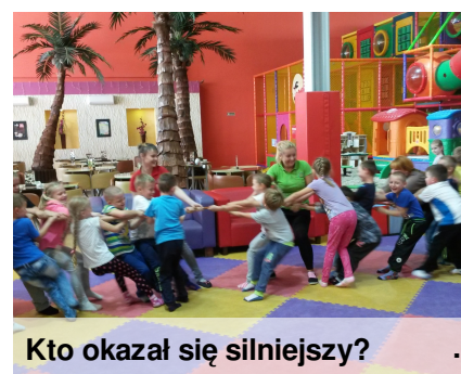
Kto okazał się silniejszy?