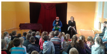
Aktorzy teatru Kurtyna

Tym razem krakowski teatr KURTYNA zaprezentował uczniom naszej szkoły spektakl "Nie jesteś sam" poruszający problemy związane z momentem przejścia młodzieży w kolejny etap dojrzewania: szkoła podstawowa - gimnazjum. Zawierał także profilaktykę używek: dopalacze, narkotyki, środki psychoaktywne, alkohol, papierosy.