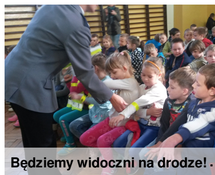
Będziemy widocznymi na drodze!