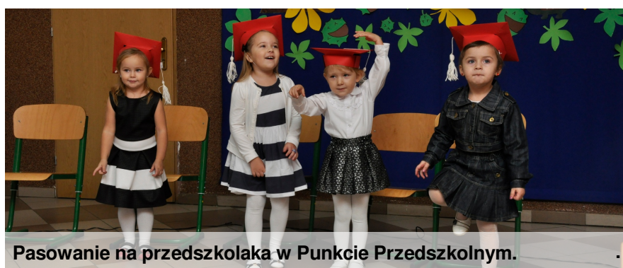
Pasowanie na przedszkolaka w Punkcie Przedszkolnym.