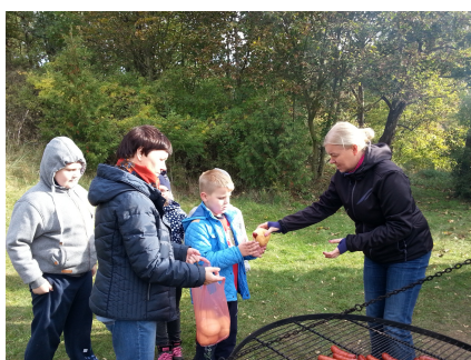
Lesne powietrze wzmacnia apetyt

7 października uczniowie klas I i III po raz kolejny gościli w leśniczówce w Leśnie. Tym razem w planie naszej wizyty znalazły się m.in. przejażdżka specjalnym wozem po lesie, wykład leśniczego na temat warstwowej budowy lasu i zwierząt tam żyjących. Mielśmy okazję zobaczyć stado danieli oraz szkółkę leśną. Na zakończenie zaprzyjaźnieni z nami leśnicy zorganizowali ognisko z pieczeniem kiełbasek oraz quiz z nagrodami.