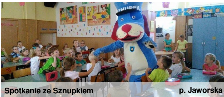
Spotkanie ze Sznupkiem

- dyskoteka z okazji Dnia Chłopaka - zagadki - krzyżówki - wycieczki klasowe - i wiele innych