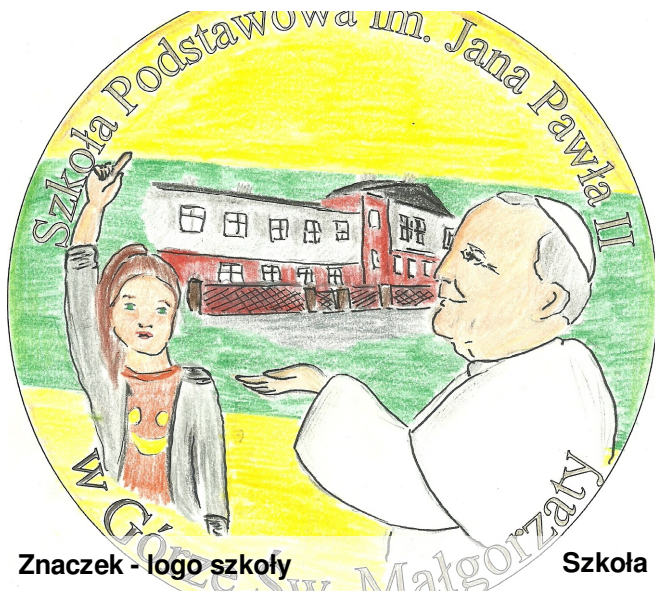
Znaczek - logo szkoły