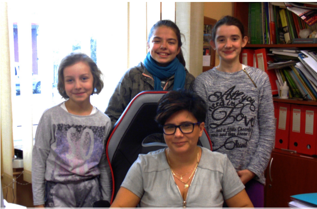
Wywiad przeprowadziły Natalia i Ola Red.