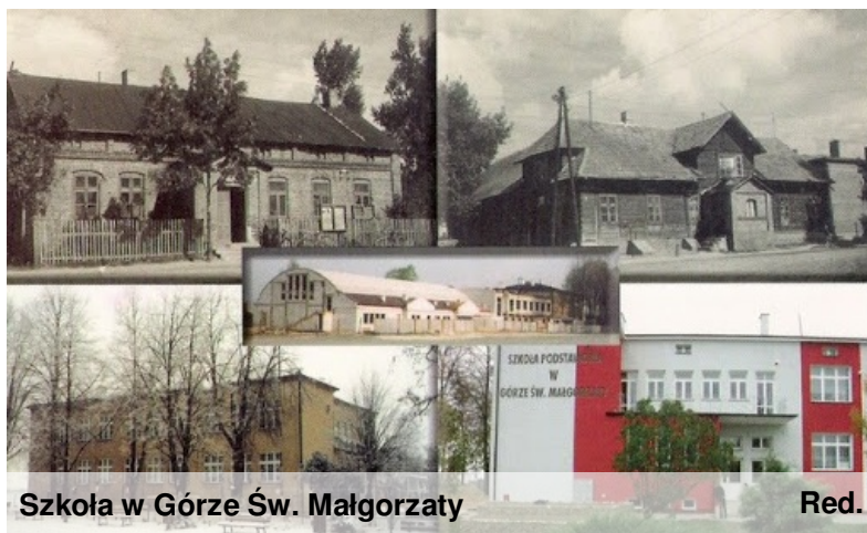
Szkoła w Górze Św. Małgorzaty