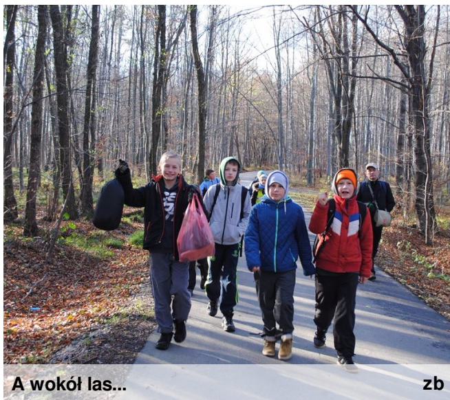
A wokół las...