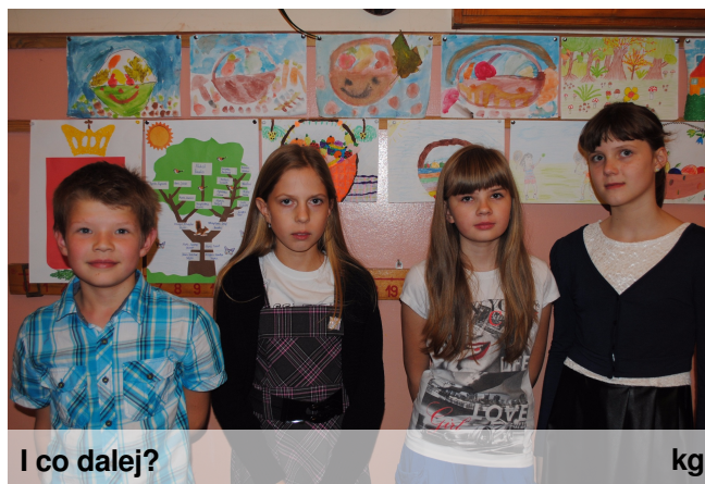
I co dalej?