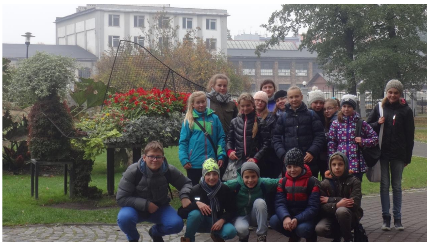
Wycieczka do Palmiarni w Gliwicach