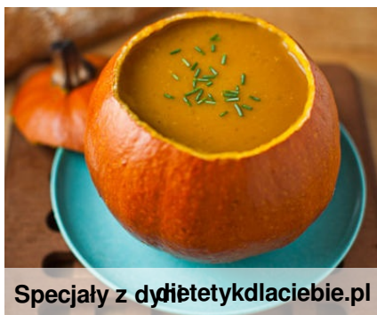
Specjały z dyni dietykdlaciebie.pl

Dynia jest bogata w minerały i witaminy, a dodatkowo ma bardzo mało kalorii. Proponuje my smaczną zupę z dyni.