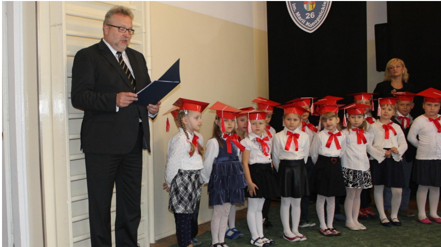
Pasowanie klas I