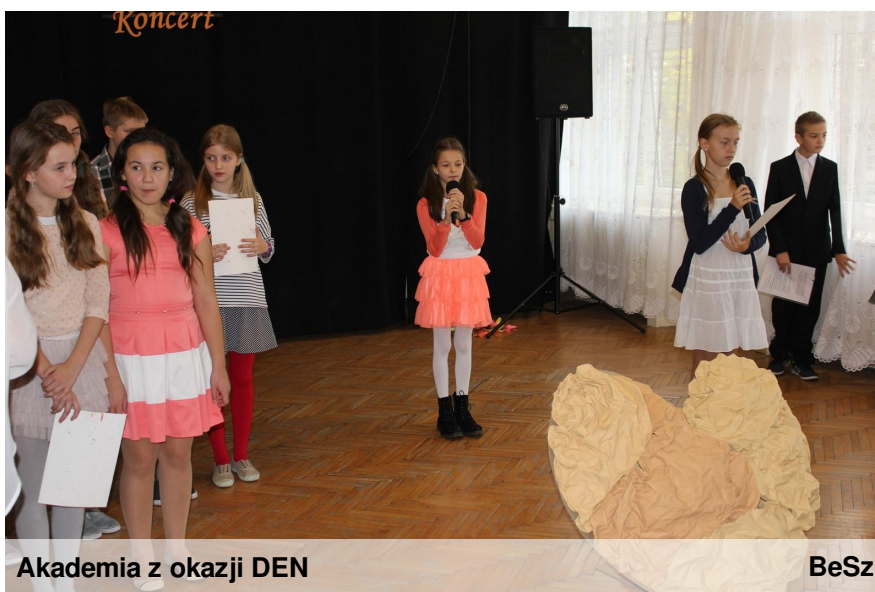
Akademia z okazji DEN

Jak co roku w naszej szkole odbyła się akademia z okazji Dnia Edukacji Narodowej. Przygotowały ją klasy czwarta i piąta oraz uczniowie z klas I i II pod opieką pani