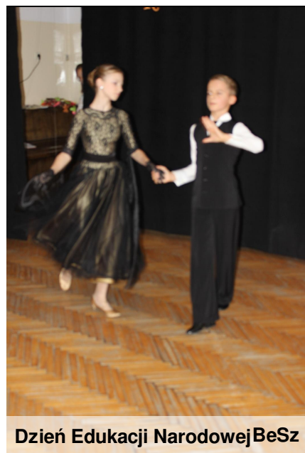
Dzień Edukacji Narodowej BeSz