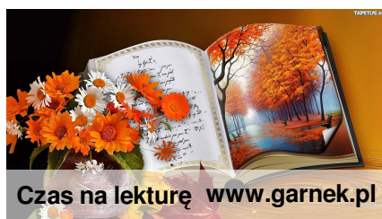
Czas na lekturę www.garneki.pl