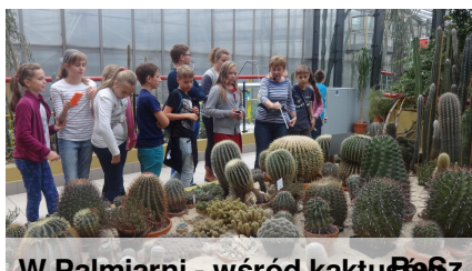
W Palmiarni - wśród kaktusów