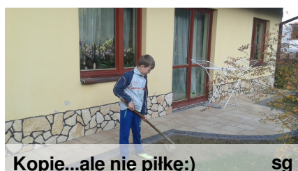
Kopie...ale nie piłkę:)