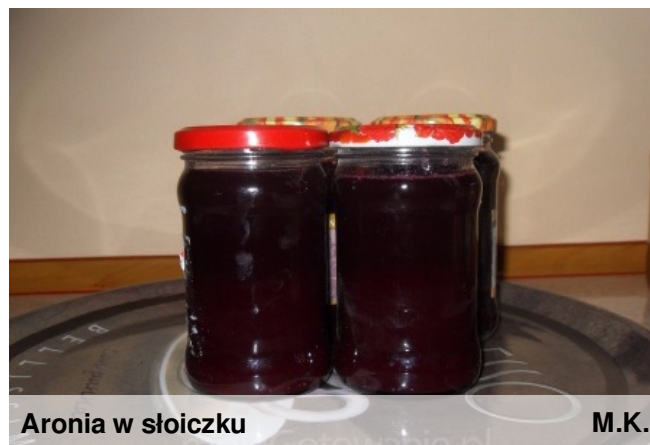
Aronia w słoiczku

aby sok był czysty i klarowny , dodać 75 dag cukru i ponownie zagotować . Wlać do słoiczków i pasteryzować. A zimą pić z herbatką lub zwykłą wodą.