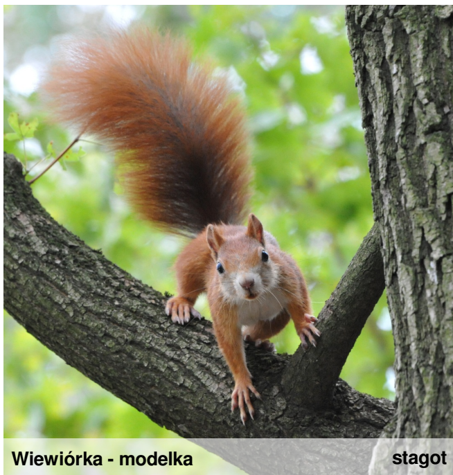
Wiewiórka - modelka