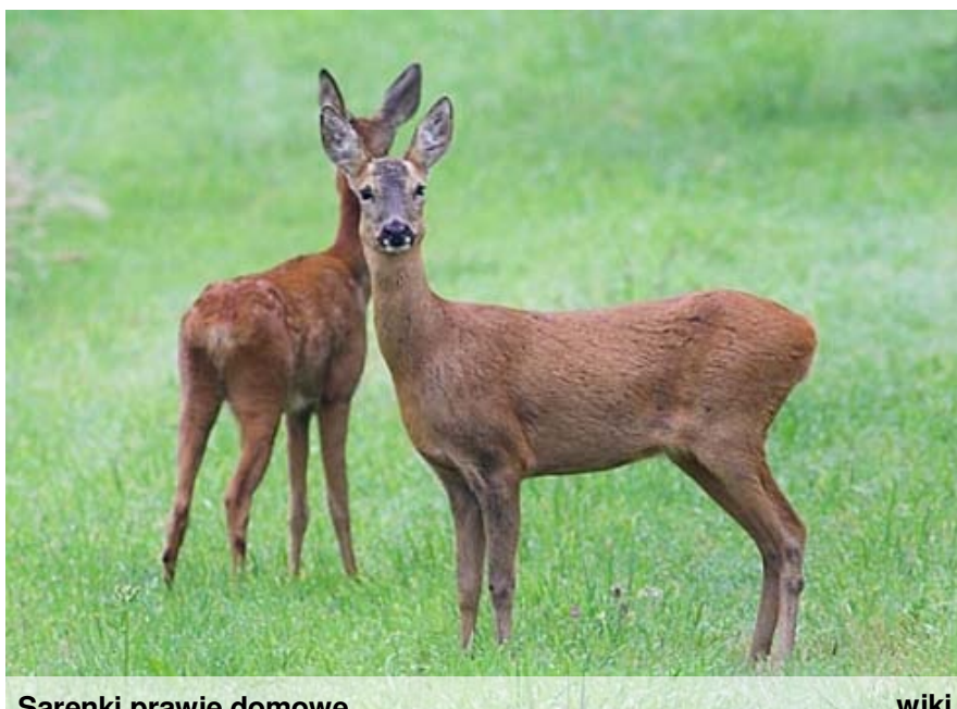
Sarenki prawie domowe