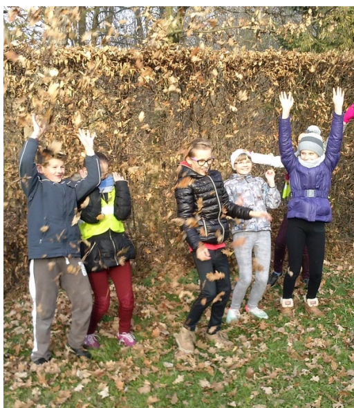
Skapani w liściach