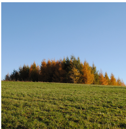
Ach, ta jesień