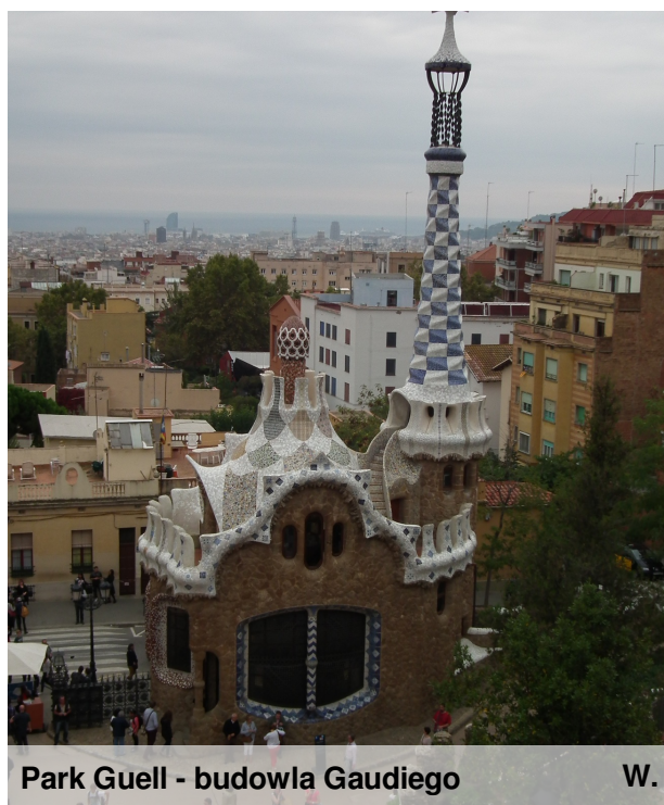
Park Guell - budowla Gaudiego