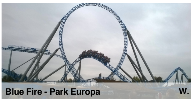
Blue Fire - Park Europa