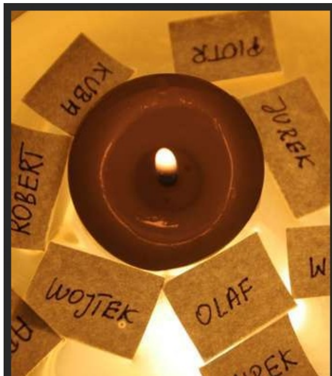
Kim on będzie?