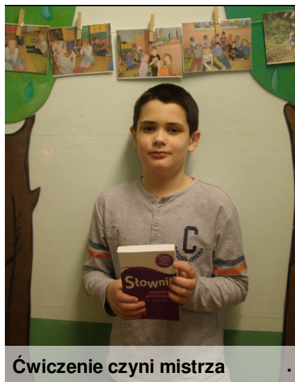
Ćwiczenie czyni mistrza