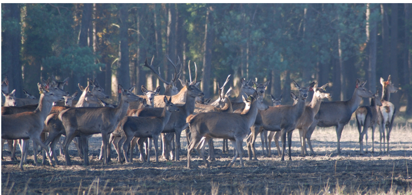
W chmarze(stadzie) różniej i bezpieczniej

"Myślę, więc jestem." Co o tym myślisz? A o czym właściwie myślisz? STOpka zaprasza do debaty.