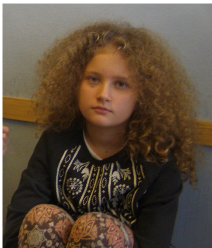
Życie w wiersz się układa .