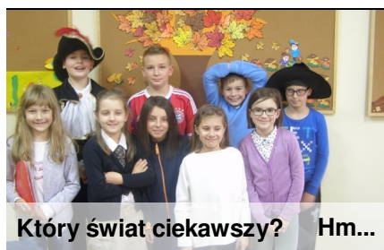
Który świat ciekawszy? Hm...