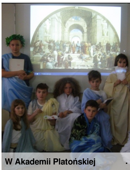
W Akademii Platońskiej