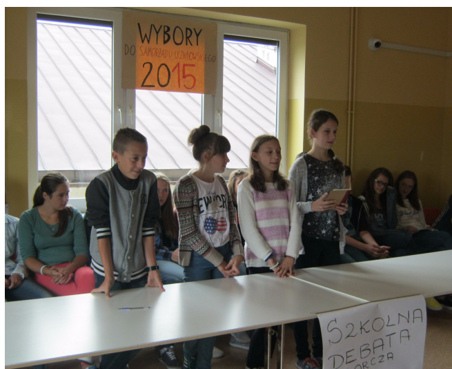
Kl. I a