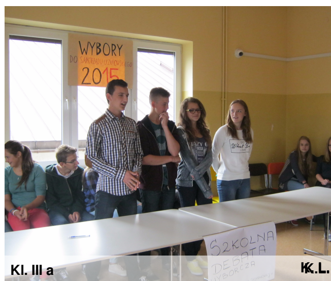
Kl. III a