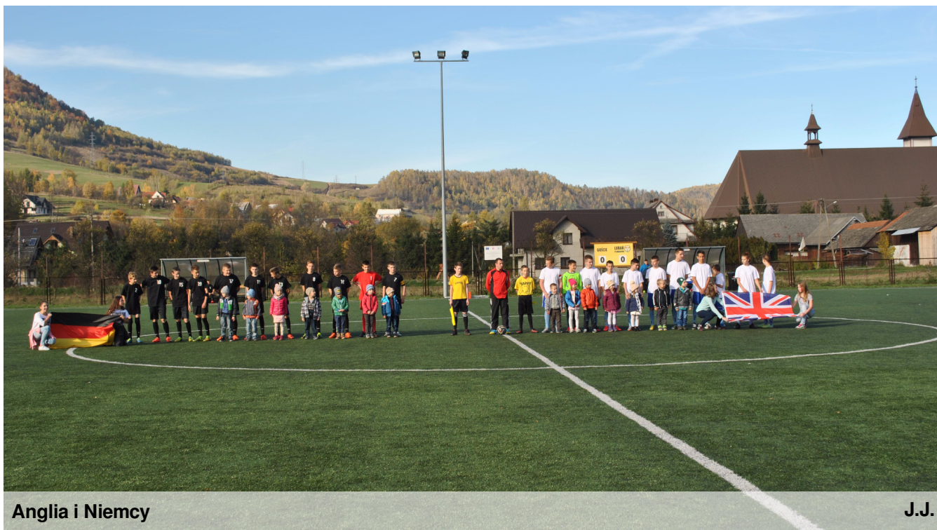
Anglia i Niemcy

29 października 2015r. został rozegrany mecz piłki nożnej między drużynami Anglii i Niemiec. Brały w nim udział klasy IIa, IIb, Ia, realizujące projekt edukacyjny "Dzień języków obcych". Wygrała drużyna w barwach niemieckich, a w przerwie meczu swój pokaz zaprezentowały cheerleaderki z klasy Ia i IIb, motywujące zawodników do walki. (red.)