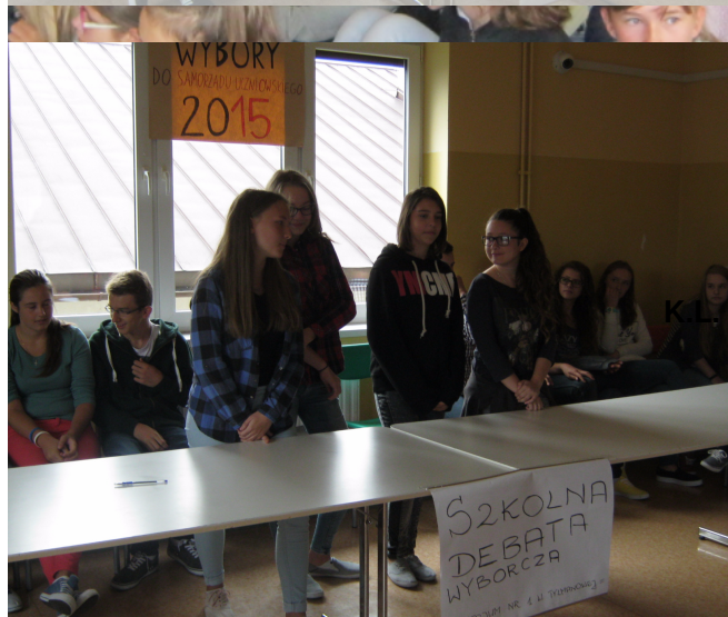
Kl. II b