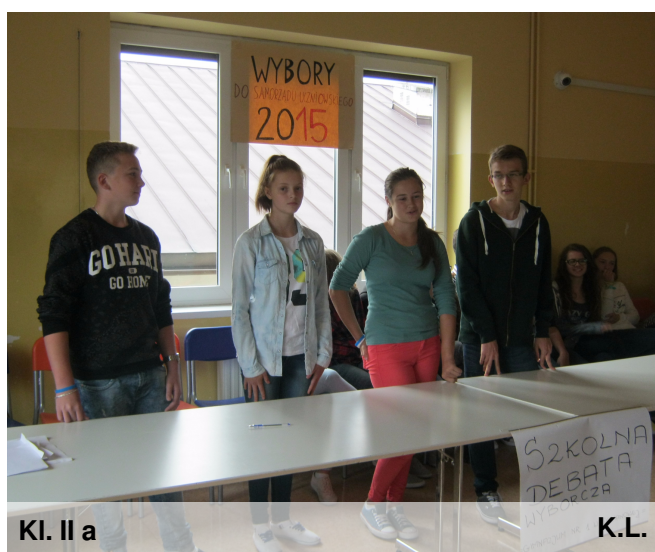
Kl. II a