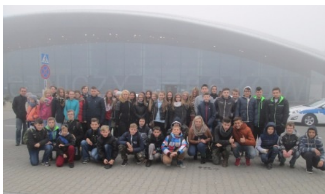
Uczestnicy wycieczki przed terminalem