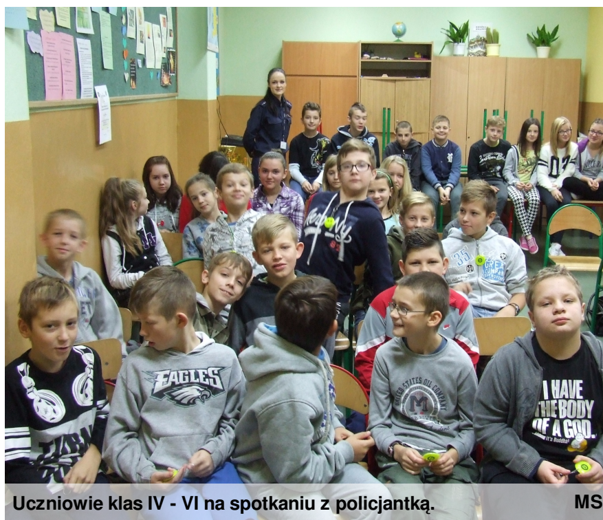
Uczniowie klas IV - VI na spotkaniu z policjantką.