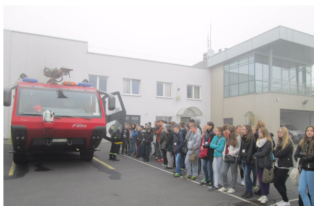
Podziwiamy straż z lotniska