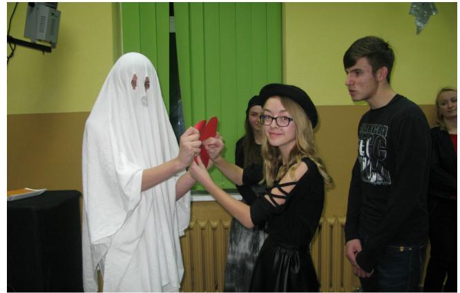
Jakie imię będzie miał mój mąż?