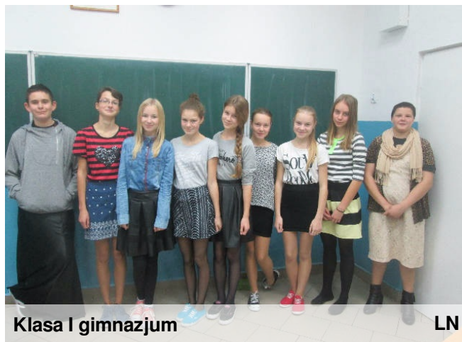
Klasa I gimnazjum