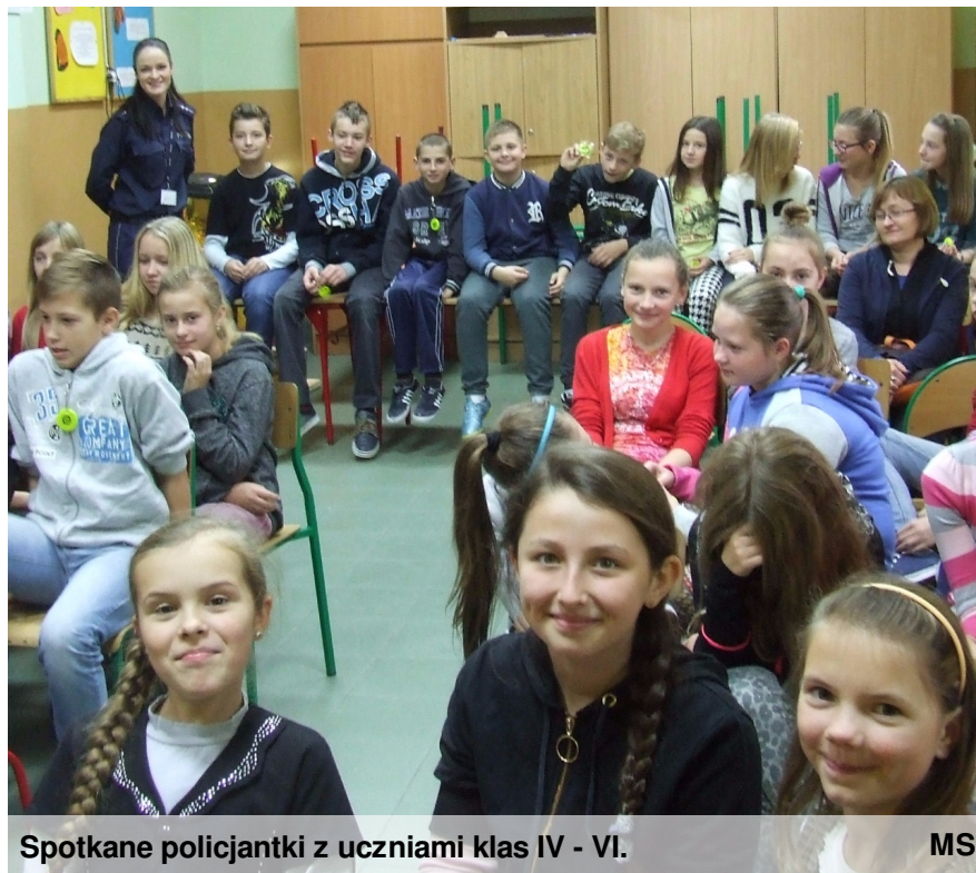
Spotkane policjantki z uczniami klas IV - VI.