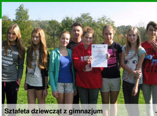
Sztafeta dziewcząt z gimnazjum

Nasza reprezentacja ze szkoły podstawowej zajmując I miejsce awansowała do zawodów