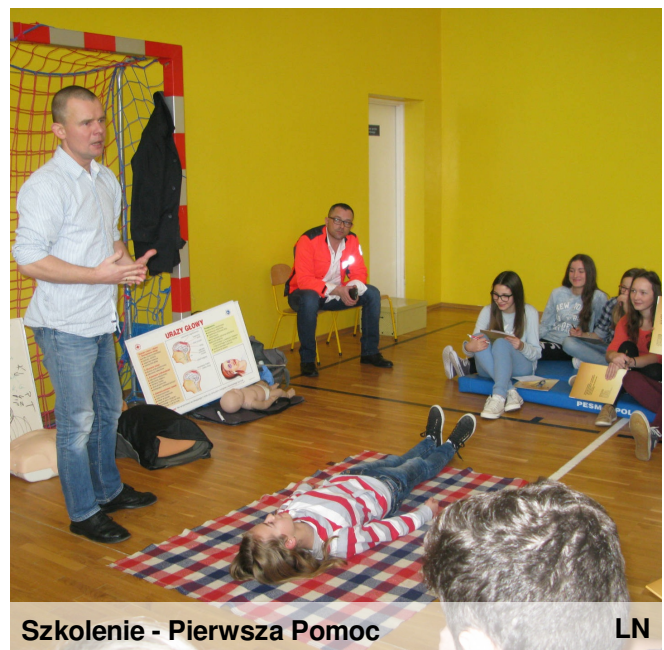
Szkolenie - Pierwsza Pomoc