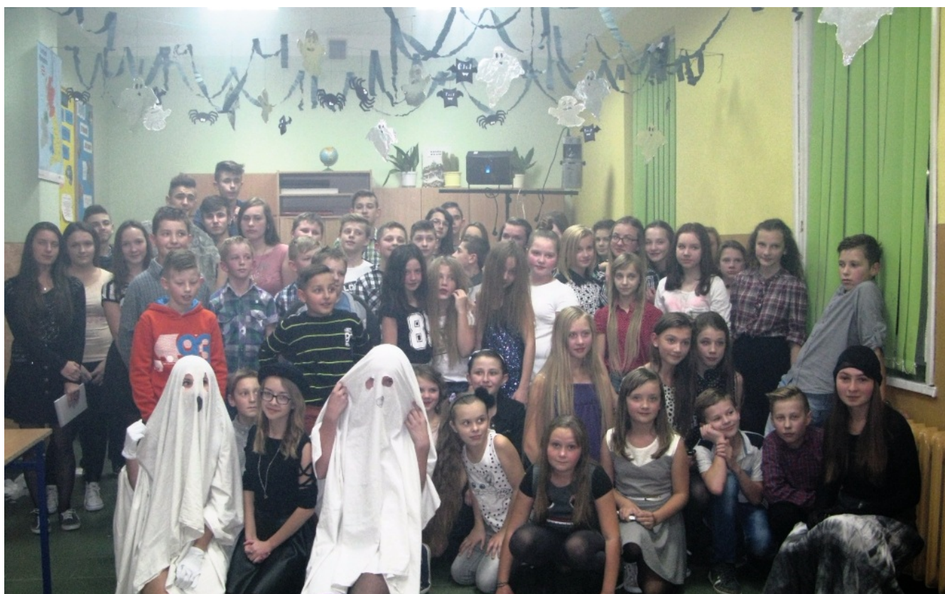
Podczas dyskoteki andrzejkowej