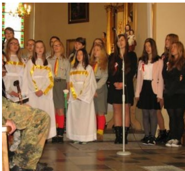
Występ w kościele