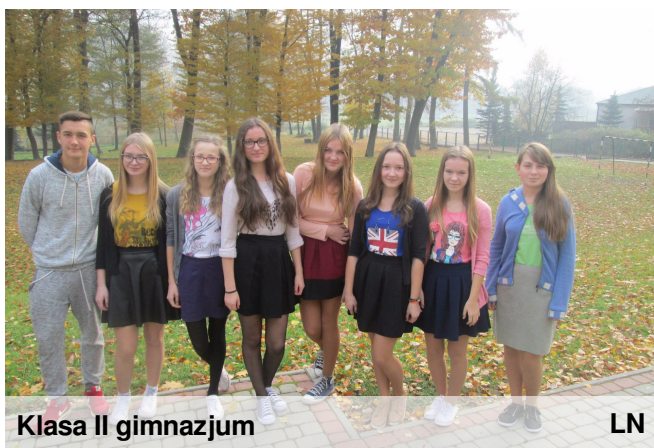
Klasa II gimnazjum