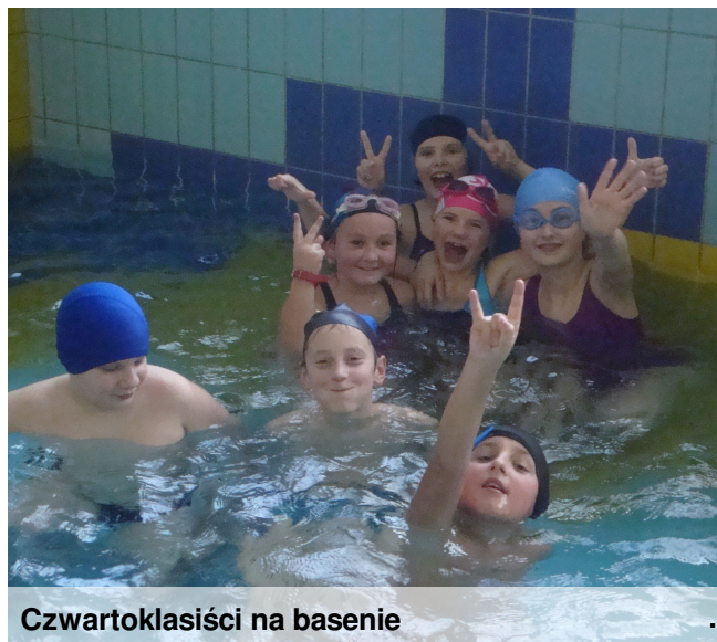
Czwartoklasiści na basenie