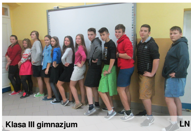
Klasa III gimnazjum