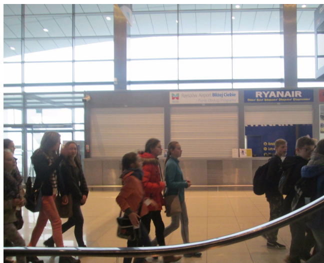
Ale ta hala duża...