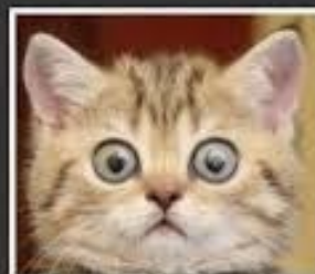
ZDJĘCIE DO DOWODU