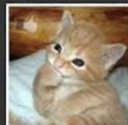
ZDJĘCIE PROFILOWE NA FB

W łóżku - jest 6 rano, zamykasz oczy na 5 minut i jest 7:45. W pracy - jest 13:30, zamykasz oczy na 5 minut i jest 13:31.