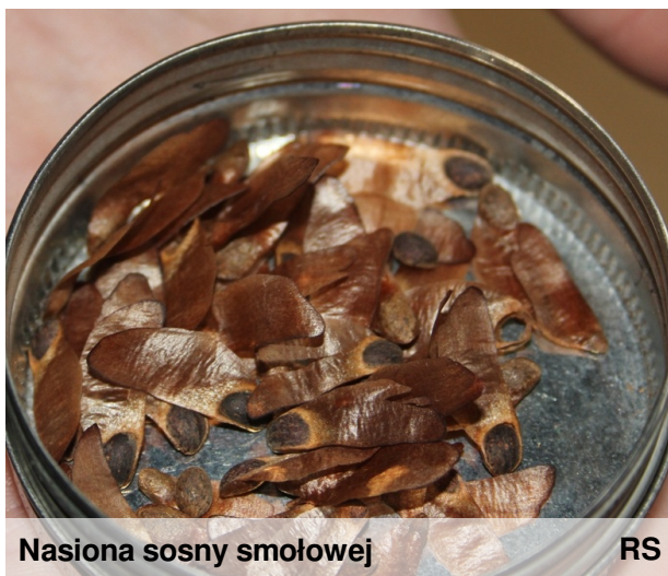
Nasiona sosny smołowej