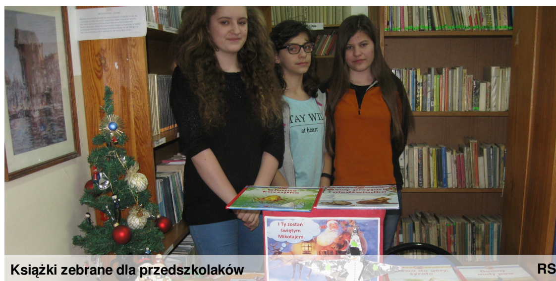
Książki zebrane dla przedszkolaków