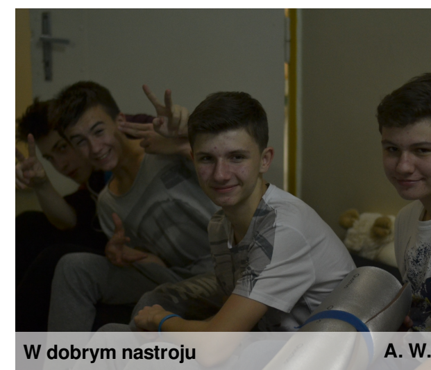
W dobrym nastroju