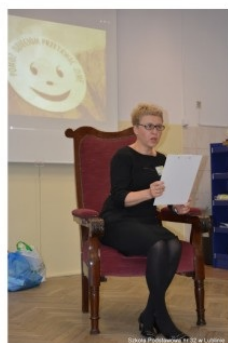
„Dzień poezji dziecięcej”

W „Dniu poezji dziecięcej” brała udział dyrekcja, nauczyciele I i II etapu edukacji, pedagog szkolna i wychowawcy z uczniami. Na dyskotekę bawiliśmy się świetnie. Połączyliśmy dobry uczynek z doskonałą zabawą.