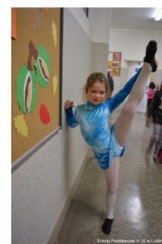
Eliminacje do „Mam Talent”