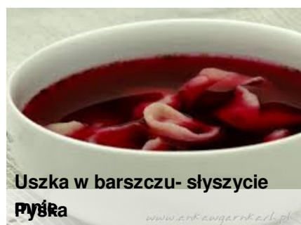
Uszka w barszczu- słyszycie