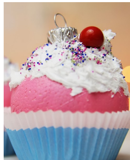
gotowa bombka — cudaczek.pl