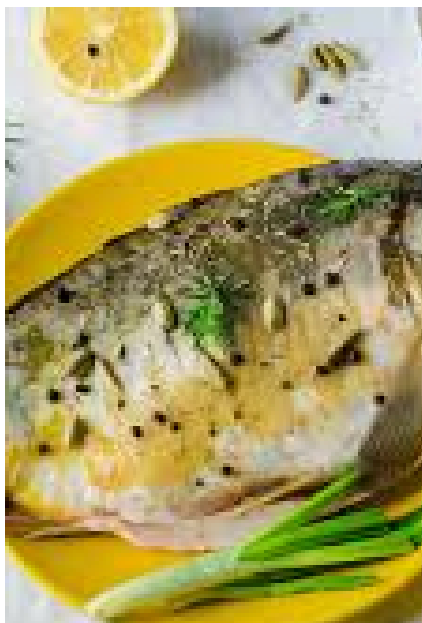
Pyśka Karp na wigilijny wieczór

Karpia po sprawieniu i usunięciu łusek, płetw i ogona myję pod zimną, bieżącą wodą nacierając go dużą ilością soli (dzięki nacieraniu solą, łatwiej pozbędziemy się śluzu ze skóry karpia). Kiedy już dokładnie umyty z soli i wysuszony, kroję go na dzwonka. Biorę kilka dorodnych cebul, które obieram z łupin i kroję w grube plastry. Biorę kilka cytryn i po sparzeniu, nie obierając ich ze skórki, również kroję w plastry.