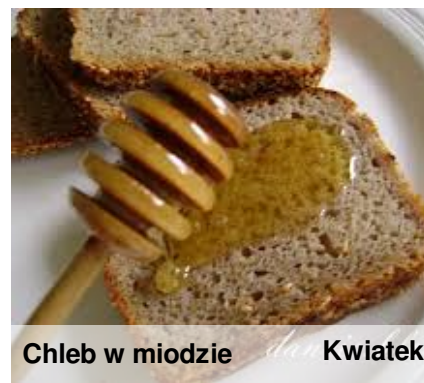
Chleb w miodzie Kwiatek