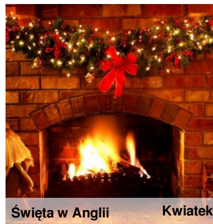
Święta w Anglii Kwiatek

Podobnie jak w Polsce, Boże Narodzenie poprzedzają 4 tygodnie adwentu. W tym czasie zaczyna się wielkie odliczanie do świąt, które symbolizuje specjalny wieniec wykonany z ostrokrzewu i ozdobiony 4 świeczkami. Również w Anglii trudno sobie wyobrazić Boże Narodzenie bez choinki. Dla większości rodzin, prawdziwe obchody świąt zaczynają się wraz z wyborem drzewka. Jedną z bardziej znanych choinek na świecie znajdziemy w Londynie. W Anglii, podobnie jak w wielu innych krajach, popularny jest zwyczaj wieszania (najczęściej przy kominku lub łóżku) specjalnej skarpetki, do której św. Mikołaj wrzuca drobne upominki.