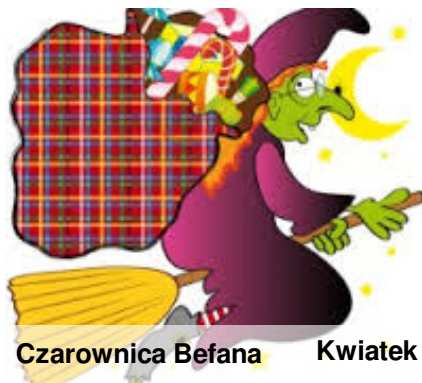
Czarownica Befana Kwiatek