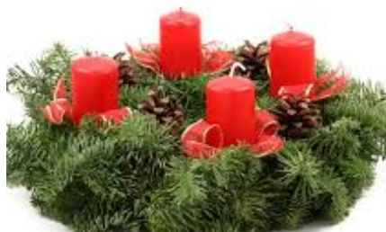
Wieniec adwentowy Kwiatek

W tych krajach przed Wigilią ojciec rodziny rysuje palcem zamoczonym w miodzie krzyże na czołach domowników. Na stole nie może zabraknąć zupy grzybowej, karpia z sałatką ziemniaczaną oraz chleba z miodem. Domownicy dzielą się opłatkiem również zamoczonym w miodzie. Po kolacji dzieci dostają prezenty od Jezuska. Potem pojawia się "vanoczka", czyli białe ciasto przypominające wyglądem i smakiem chałkę z bakaliami. Na stołach niekiedy stawia się naczynia z ziarnem zbóż i drobnymi monetami.