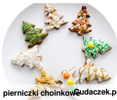
pierniczki choinkowe Cudaczek.pl

Dobra rada. Jeśli chcesz żeby pierniki były smaczniejsze do ciasta dodaj powidła śliwkowe.