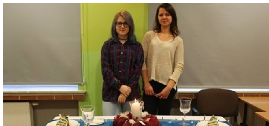
Laureatki 2. miejsca