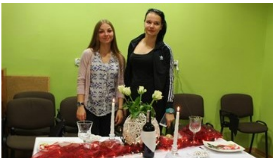
Laureatki 3. miejsca ex aquo