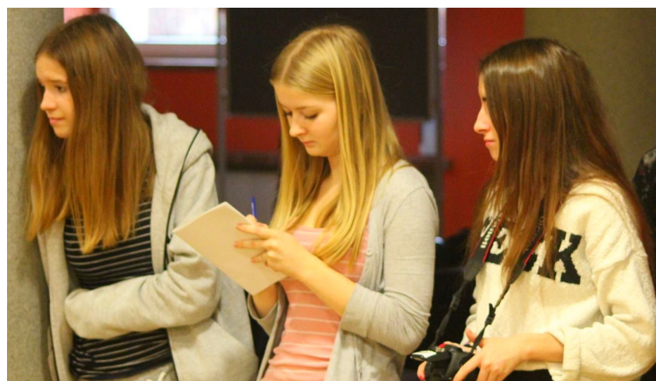
Redaktorki przy pracy