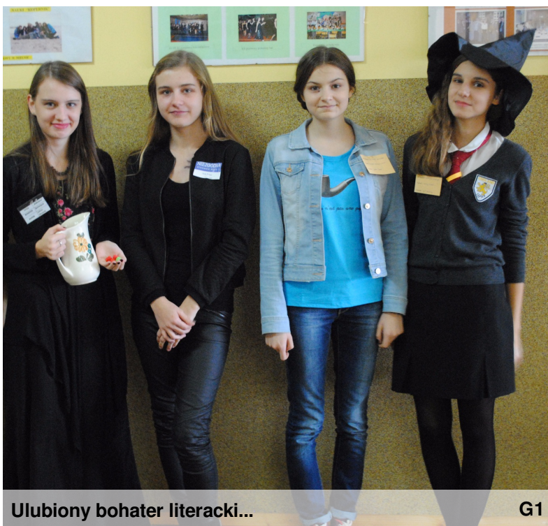
Ulubiony bohater literacki...

Październik to miesiąc bibliotek szkolnych, w czwarty poniedziałek tego miesiąca obchodzony jest Międzynarodowy Dzień Bibliotek Szkolnych. W naszej szkole przeprowadzone zostały dwie akcje czytelnicze. Pierwsza w formie konkursu „Zostań książkowym bohaterem”, uczniowie mogli wcielić się w dowolnie wybraną postać literacką. Najciekawsze, najbardziej pomysłowe kreacje wyróżniła komisja konkursowa w składzie: nauczyciele- bibliotekarze, pedagog szkolny i przewodniczący Samorządu Uczniowskiego. Druga akcja „Twoja wymarzona książka w bibliotece szkolnej” jest długoterminowa, uczniowie mogą wpisywać na listę pozycje książkowe, które ich zdaniem powinny znaleźć się w zasobach biblioteki. Lista ta zostanie przekazana do Dyrekcji szkoły w celu spełnienia marzeń czytelniczych naszych uczniów.