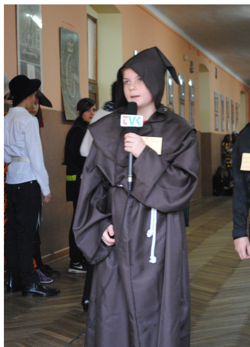
Ulubiony bohater literacki...