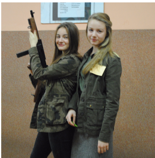
Ulubiony bohater literacki...