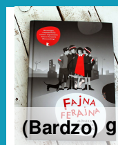
(Bardzo) 9 Fajna Ferajna