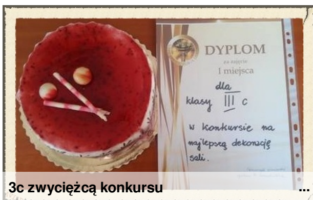
3c zwyciężcą konkursu

Po krótkim odpoczynku wyruszyliśmy w teren. W czasie drogi bez przerwy otrzymywaliśmy wiele zadań, które wymagały pracy zespołowej. Po powrocie z terenu czekało nas już tylko pieczenie kiełbasek na ognisku. Wycieczka bardzo mi się podobała i pojechała bym tam jeszcze raz. Patrycja Ostrowska, 2b