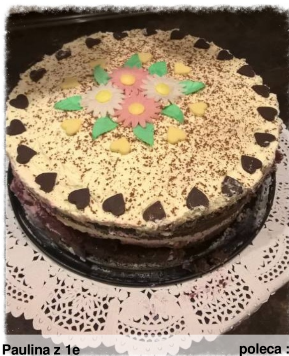
Paulina z 1e