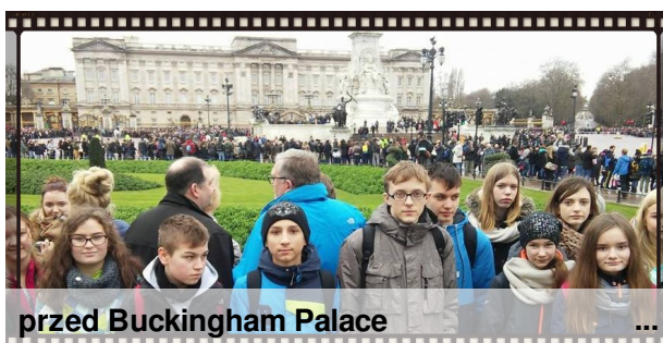
przed Buckingham Palace