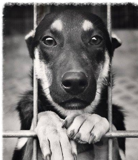
Czekamy na Waszą pomoc