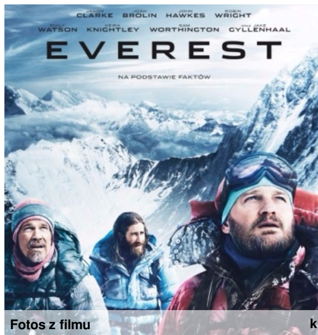
Fotos z filmu