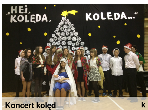
Koncert kołęd k

Styczeń rok stary z nowym styka, czasem zimnem do kości przenika, czasem w błocie utyka.