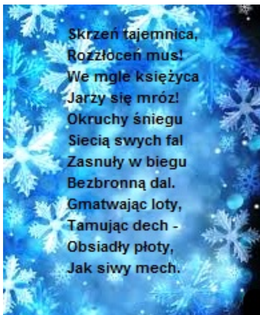
Bolesław Leśmian "Noc zimowa" k

Styczeń rok stary z nowym styka, czasem zimnem do kości przenika, czasem w błocie utyka.