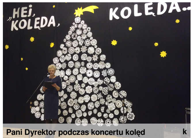
Pani Dyrektor podczas koncertu kolęd

Pani Dyrektor: Ktoś, kto przeczyta ten wywiad, może się zdziwić, ale z dzieciństwa ukochana książka to „Dzieci z Bullerbyn”, z młodości „Nad Niemnem”.