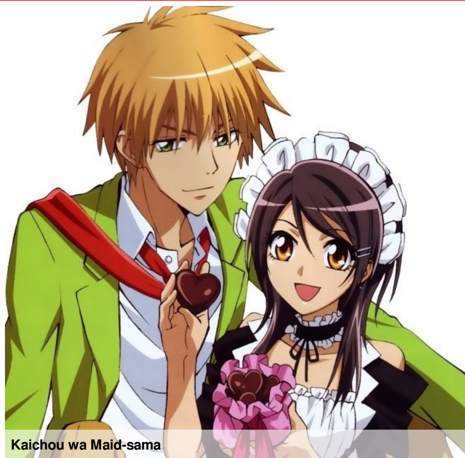
Kaichou wa Maid-sama