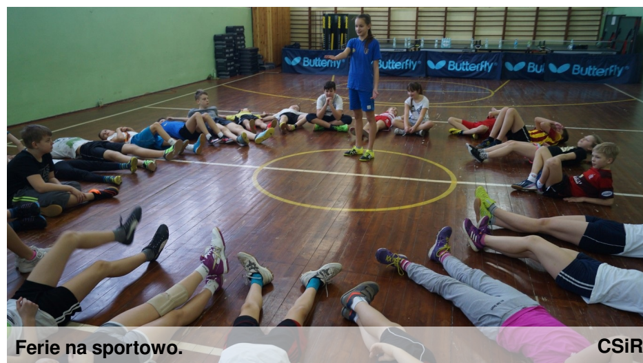
Ferie na sportowo.

W pierwszym tygodniu ferii, 18 stycznia, odbyły się szkolne zawody w siatkówkę dla uczniów z gimnazjum. Każda z klas naszego gimnazjum wystawiała swoją reprezentację. W drużynie musiało grać trzech chłopaków i trzy dziewczyny. Turniej polegał na tym, że drużyny zostały podzielone na grupy. W jednej grupie znalazły się dwie pierwsze klasy i jedna trzecia, a w drugiej dwie drugie i jedna trzecia. Drużyny, które zajęły pierwsze miejsce w grupie, awansowały do finału. Mecz finałowy stoczyły klasy trzecia „a” i trzecia „b”. Mecz był bardzo zacięty, ale niestety skończył się wynikiem 2:1 dla klasy trzeciej „b”. Trzecie miejsce zajęła klasa 2 „a”, czwarte 1 „b”, piąte pierwsza „a” i szóste 2 „b”. Wszyscy uczestnicy bardzo byli zadowoleni z zawodów i już nie mogą się doczekać kolejnych. JT