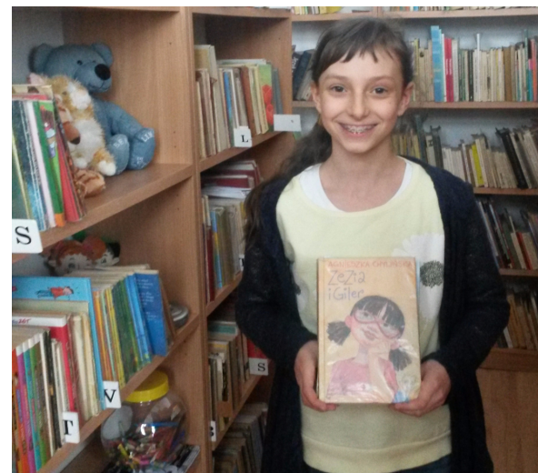
Recenzentka z książką