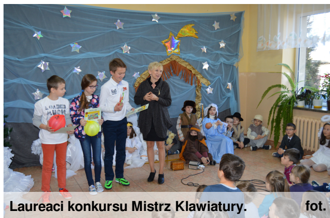
Laureaci konkursu Mistrz Klawiatury.

Przedszkolaki wraz z wychowawczynią przygotowały przed Świętami Bożego Narodzenia pierniczki świąteczne. Zapach pieczonych ciasteczek wprowadził wszystkich w nastrój świąteczny. Udekorowane własnoręcznie pierniczki smakowały wyśmienicie.