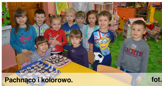
Pachnąco i kolorowo.