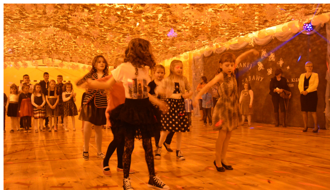
Taniec dziewczyn z trzeciej.