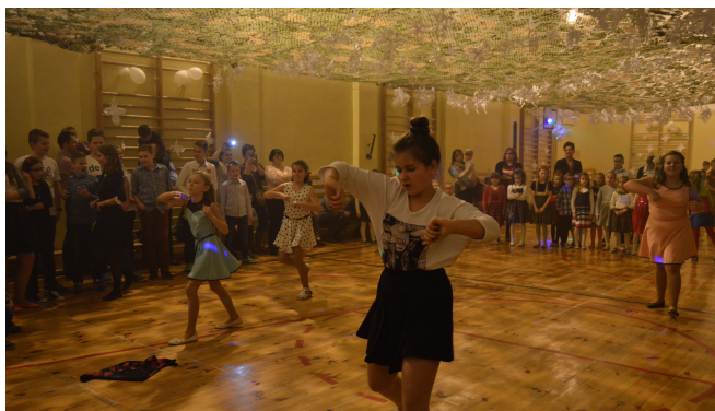
Taniec dziewczyn z piątej.