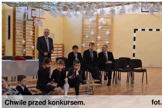
Chwile przed konkursem.