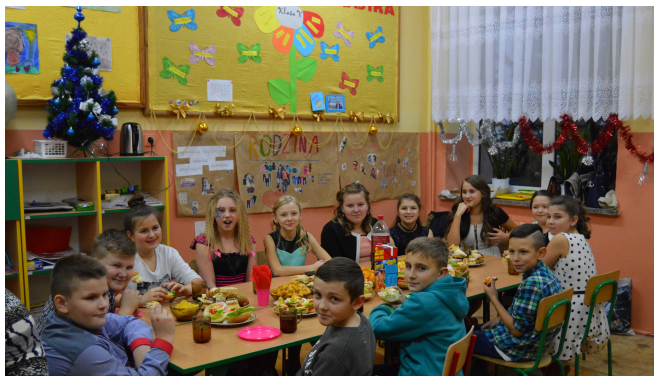
Poczęstunek w klasie V.