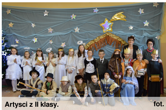
Artysty z II klasy.