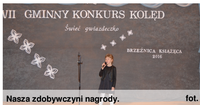
Nasza zdobywczyni nagrody.