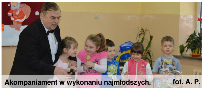
Akompaniament w wykonaniu najmłodszych.