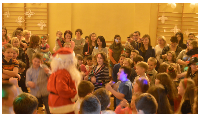
"Wyginam śmiało ciało".