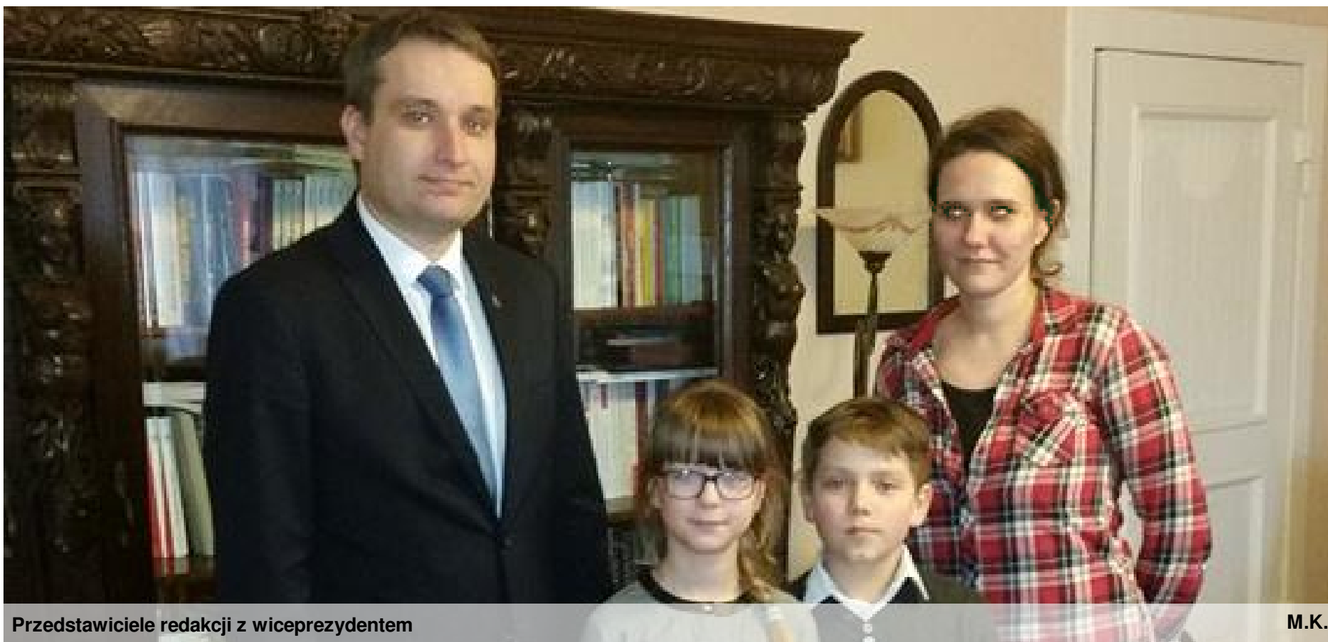
Przedstawiciele redakcji z wiceprezydentem