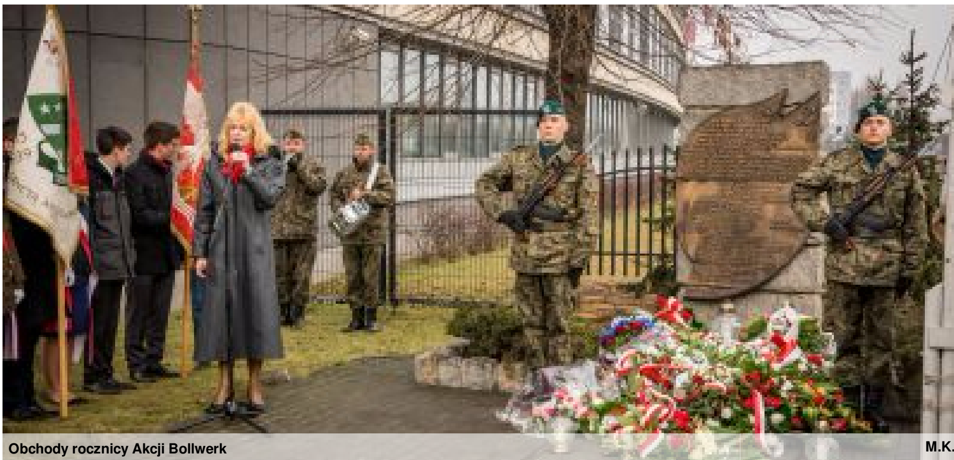
Obchody rocznicy Akcji Bollwerk