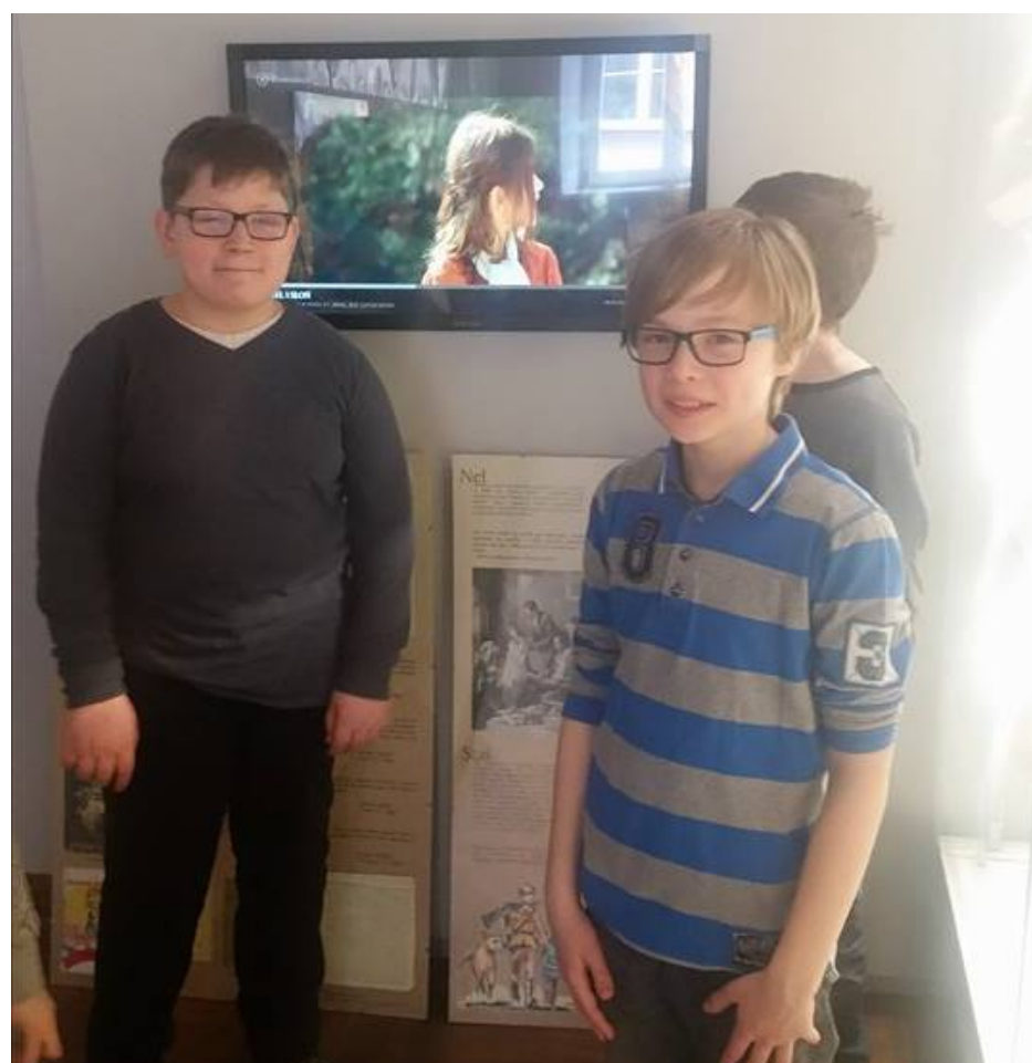
Podczas oglądania „W pustyni i w puszczy”