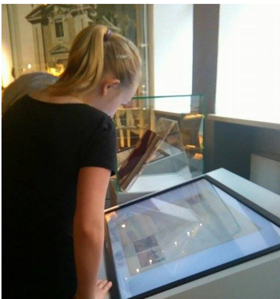
Nie brakowało multimedialnych atrakcji