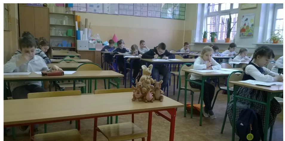
Uczniowie podczas zmagani