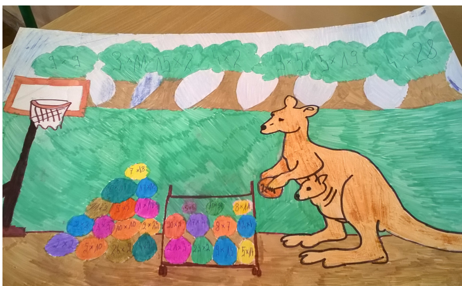
Jedna z prac naszych uczniów