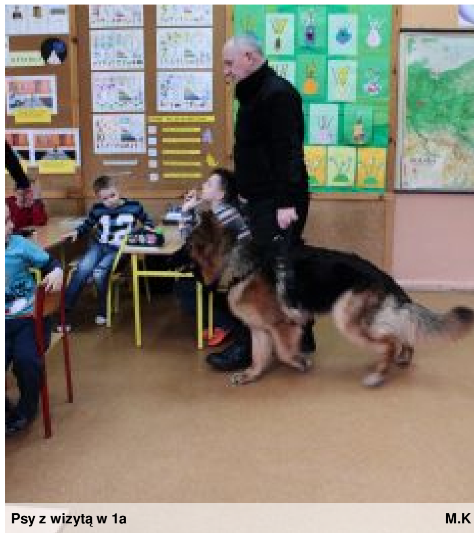
Psy z wizytą w 1a