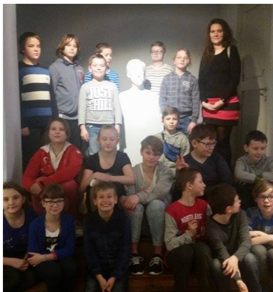
Obowiązkowe zdjęcie grupowe