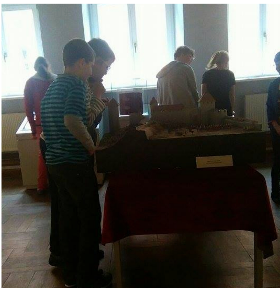
Makieta bitwy - Kamieniec Podolski