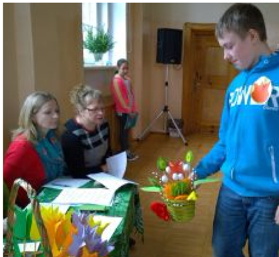
Prezentacja wykonanych prac i ocena jury