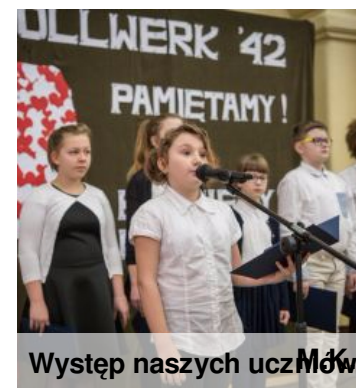
Występ naszych uczniów

Rocznica Akcji Bollwerk to jedno z najważniejszych wydarzeń w życiu naszej szkoły - każdego roku uroczymy ją świętujemy. Przypomnijmy sobie jak uczciliśmy ją w lutym.