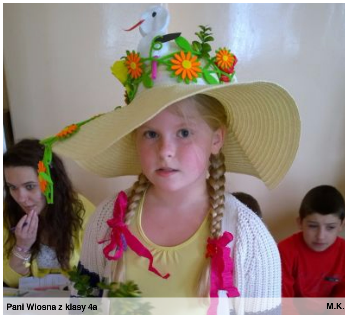
Pani Wiosna z klasy 4a