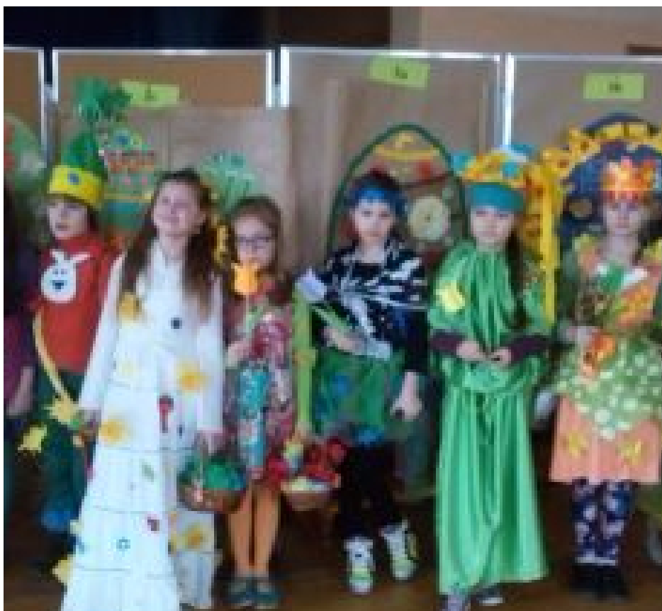
Klasy I-III w przebraniach