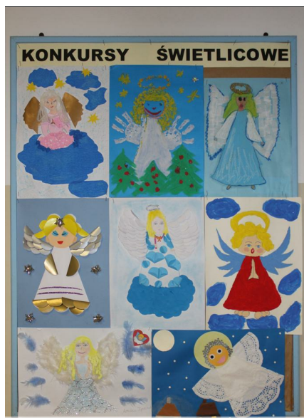
Prace konkursowe "czuwać nad Wami anioły..."

Rozmawia dwóch komputerców: - Co byś zrobił jakbyś zobaczył super dziewczynę? - Natychmiast bym ją ściągnął z sieci i zapisał na dysku.