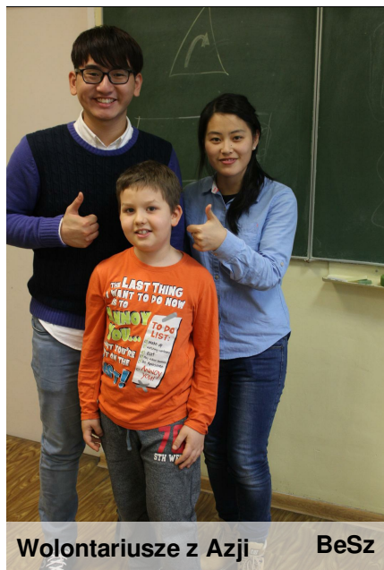
Wolontariusze z Azji

Jasełka wystawione przez uczniów podczas Dnia Babci i Dziadka oraz tańce przedszkolaków spotkały się z aplauzem ze strony zaproszonych gości.