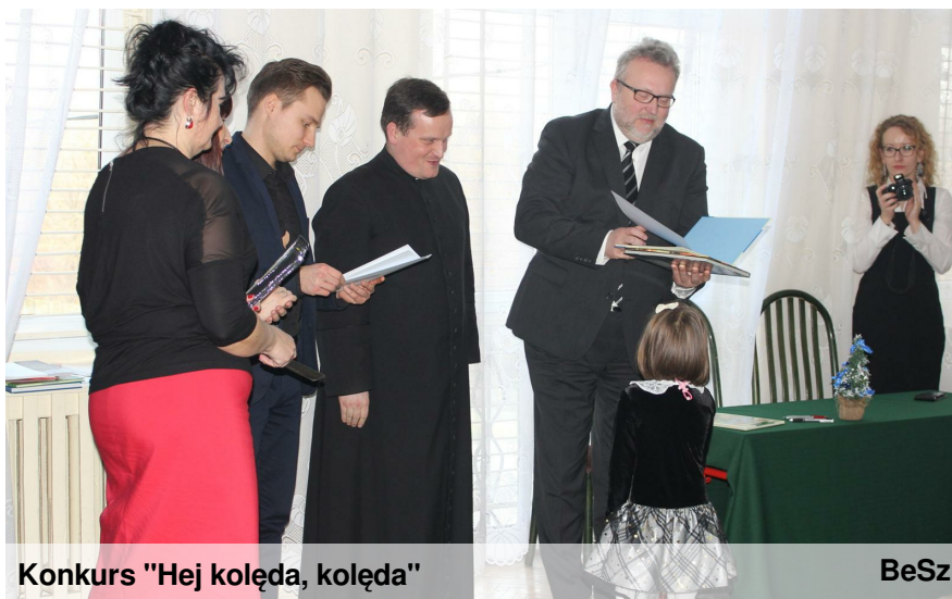
Konkurs "Hej kolęda, kolęda"

23.01.2016 odbyła się szósta zabawa karnawałowa. Dzieci miały okazję zaprezentować wspaniałe stroje i wspaniale się bawić przy dźwiękach skocznej muzyki.