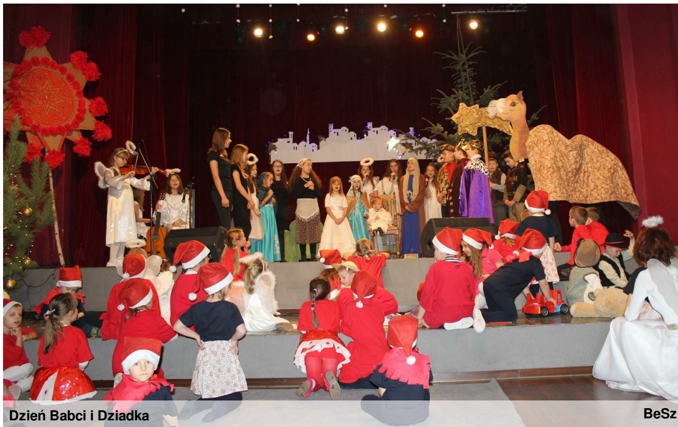
Dzień Babci i Dziadka