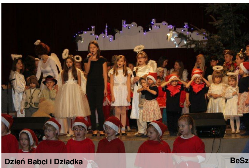
Dzień Babci i Dziadka

Tradycją Szkoły Podstawowej nr 26 w Dąbrowie Górniczej jest coroczne uroczyste obchodzenie Dnia Babci i Dziadka.