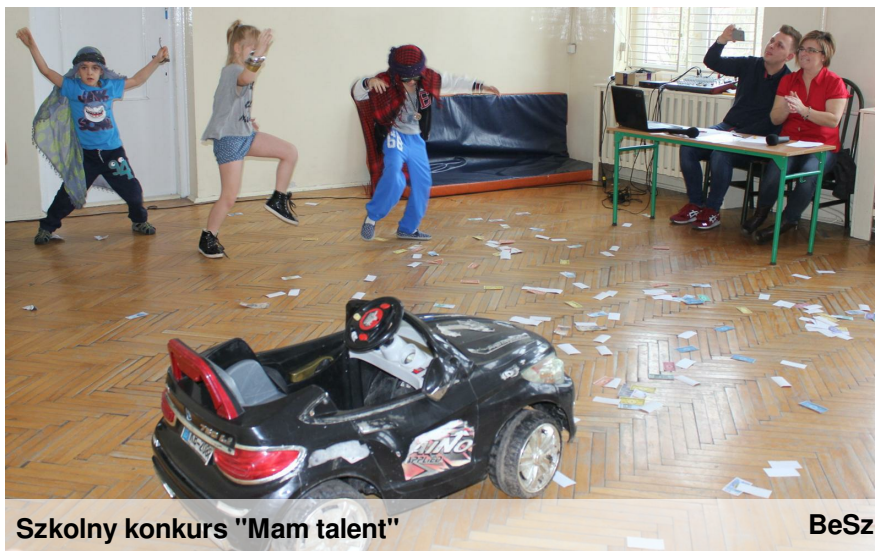
Szkolny konkurs "Mam talent"

Wicie dlaczego Fiat 126p ma z tyłu podgrzewane szyby? - Żeby tym, co go zimą pchają mieli ciepło w ręce.